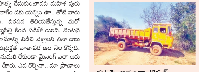
గుట్టపై అడ్డుగా టిప్పర్

బల్యూరు మండలం మైలారంలో మైనింగ్ పనులను నిరోధించే అందోళనల కొనసాగుతూనే ఉన్నాయి. కొన్ని నెలలుగా పనులను ఆపాలని అడ్డుకుంటూ వారిపై కేసులు నమోదు చేశారు. అధికారులు, ప్రభుత్వం నుంచి స్పందన కలగలేదు. ఈ నేపథ్యంలో 20వ తేదీ నుంచి 27వ తేదీ వరకు శాంతియుతంగా నిరసన రిలే నిరాహార దీక్షలు చేయడానికి నిర్ణయం తీసుకున్నారు. అయితే ఈ విషయం తెలుసుకున్న పోలీసులు తెల్లవారుజాము 5 గంటలకే గ్రామానికి చేరుకొన్నారు. ఉదయం నుంచి పాలాపద్ద.. ఇండ్ల వద్ద ఉన్న పలు ఘన అదుపులోకి తీసుకుని పోలీస్ స్టేషన్ కు తరలించారు. దీంతో ఆగ్రహం వ్యక్తం చేస్తూ గ్రామంలోకి పోలీసులు రాకుండా ప్రధాన రోడ్లపై కంపెనీలు.. కట్టలను వేశారు. అరెస్టు చేసిన వారిని వెంటనే విడుదల చేయాలని