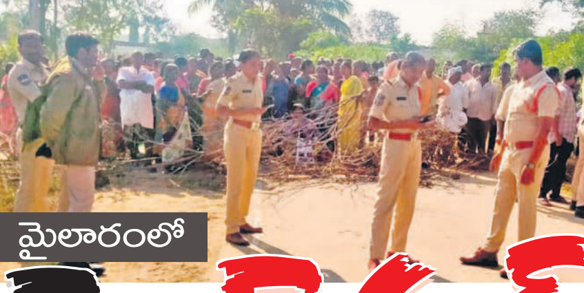
మైలారంలో మైనింగ్ అపరాధం.. పోలీసులు గ్రామంలోకి రావద్దంటూ రోడ్లపై కంపెనీ స్టాంపుల నిరసన

మైలారం గ్రామంలో జరుగుతున్న మైనింగ్ పనులను పోలీస్ కంట్రోల్ కోసం వచ్చిన ఫ్రీంట్, ఎలక్ట్రానిక్ మిడియాను మాఫీయా అడ్డుకున్నది. అక్కడ పనులు చేస్తున్న నిబ్బంది మిడియాపై బిందులు వేశారు. పని వద్దకు వెళ్లకుండా గుట్టపై అడ్డుగా టిప్పర్ ను ఉంచారు. మిడియాకు అనుమతి లేదంటూ దురుసుగా వ్యవహరించారు.