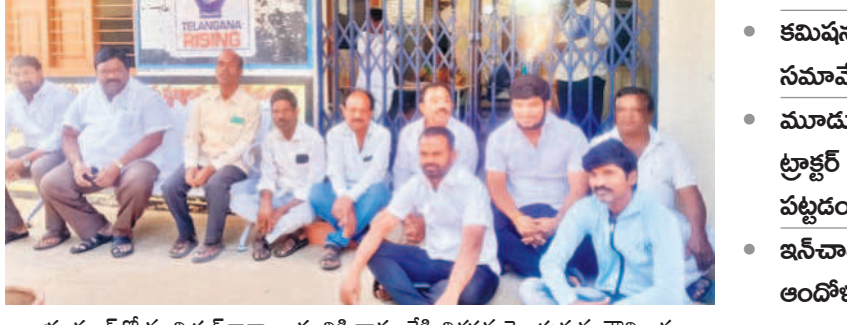
భూత్పూర్లో మున్సిపల్ కార్యాలయానికి తాళం వేసి నిరసన తెలుపుతున్న కౌన్సిలర్లు

భూత్పూర్, జనవరి 20 : కౌన్సిలర్ల కన్నెర్ల ప్రభుత్వం, భూత్పూరు మున్సిపల్ కార్యాలయంలో అధికారులు విధులు నిర్వహిస్తుండగానే తాళం వేశారు. అభివృద్ధి పనులు చేపట్టడం లేదని.. సమస్యలు పట్టి చూడడం లేదని ఆరోపించారు. సోమవారం బల్యూరు అసెంబ్లీ నిరసన తెలిపారు. సోమవారం బల్యూరు అసెంబ్లీ నిరసన తెలిపారు. సోమవారం బల్యూరు అసెంబ్లీ నిరసన తెలిపారు. సోమవారం బల్యూరు అసెంబ్లీ నిరసన తెలిపారు.