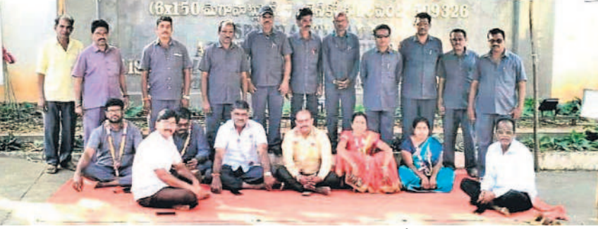
శ్రీశైలంలో లిలే సహకారదీక్షలు చేపట్టిన విద్యుత్ జేసీని నాయకులు

● శ్రీశైలం జేసీకో కార్యాలయం ఎదుట లిలే సహకారదీక్షలు ప్రారంభం డోమల వెంకట, జనవరి 20 : విద్యుత్ సంస్థలో పని చేస్తున్నటువంటి ఆర్థిజన్లకు కచ్చితంగా రెగ్యులర్ ఉద్యోగులుగా గుర్తించాలని తెలంగాణ విద్యుత్ ఆర్థిజన్ల కన్సర్జన్- జాయింట్ యూజ్ కమిటీ డిమాండ్ చేసింది. ఈ మేరకు సోమవారం శ్రీశైలం ఎడమ గట్టు జలవిద్యుత్ కేంద్రం సర్కిల్ కార్యాలయం ఎదుట ఆర్థిజన్ల రిలే నిరవహారం చేపట్టారు. ఈ సందర్భంగా తెలంగాణ విద్యుత్ ఆర్థిజన్ల కన్సర్జన్- జాయింట్ యూజ్ కమిటీ నాయకులు మాట్లాడుతూ సుమారు 20వేల మంది ఆర్థిజన్ల కార్యాలయ గడివిన ఐదు నెలలుగా వివిధ రూపాల్లో ఆందోళన కార్యక్రమాలను చేపట్టిన, ఎన్టీడీసీఎల్, ఎన్టీడీసీ