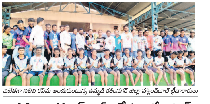
విజేతగా నిలిచి కమన్ అందుకుంటున్న ఉమ్మడి కరీంనగర్ జిల్లా హ్యాండ్ బాల్ క్రీడాకారులు