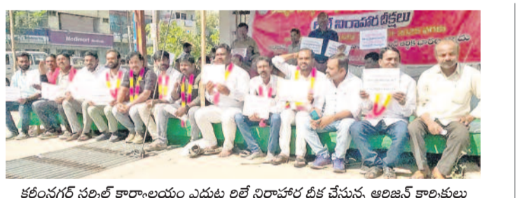
కరీంనగర్ సర్కార్ కార్యాలయం ఎదుట లిలే నిరాహార దీక్ష చేస్తున్న అర్జిజన్ కార్మికులు