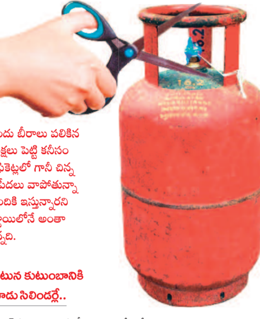
సగటున కుటుంబానికి మూడు సిలిండర్లలో..

సబ్బిడి సిలిండర్ అటకెక్కుతున్నది. మహాఅక్షి పథకంలో ₹500కే అందిస్తామని ఎన్నికల ముందు బీరాలు పలికిన కాంగ్రెస్ సర్కారు, తీరా గెలిచిన తర్వాత తుస్సుమనిపిస్తున్నది. అనేక కొర్రలు, సహజ అక్షం పెట్టి కనీసం 50 శాతం మందికి కూడా రాయితీ ఇవ్వడం లేదని తెలుస్తున్నది. అయితే అక్టోలో గానీ, సబ్బిడికి గానీ చిన్న అక్షర డోపం ఉన్నా లిజెక్ట్ చేస్తున్నదని, కార్యాలయాల మట్లా తిరగలేక అలసిపోతున్నామని పేదరా పాపోతున్నాయం ప్రాంతంగా నుంచి సరైన స్పందన కరువవుతున్నది. అయితే లబ్ధిదారులు లెక్క ఎంతమందికి ఇస్తున్నారని అడిగితే తమకు తెలియదనడం, వివరాలు అత్యంత గోప్యంగా ఉండడం, హైదరాబాద్ స్టాయిలోనే అంతా జరుగుతున్నదని అధికారులు చెబుతుండడం అనేక అనుమానాలకు తావిస్తున్నది.