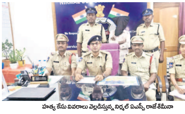
హత్య కేసు వివరాలు వెల్లడిస్తున్న నిర్మల్ ఎమ్మెల్యే రాజేశ్వరీ