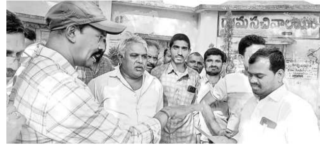
మహబూబాబాద్ జిల్లా నర్సింహాలపేట మండలం వందలపల్లెలో పంచాయతీ కార్యదర్శిని నిలబెట్టిన గ్రామస్థులు