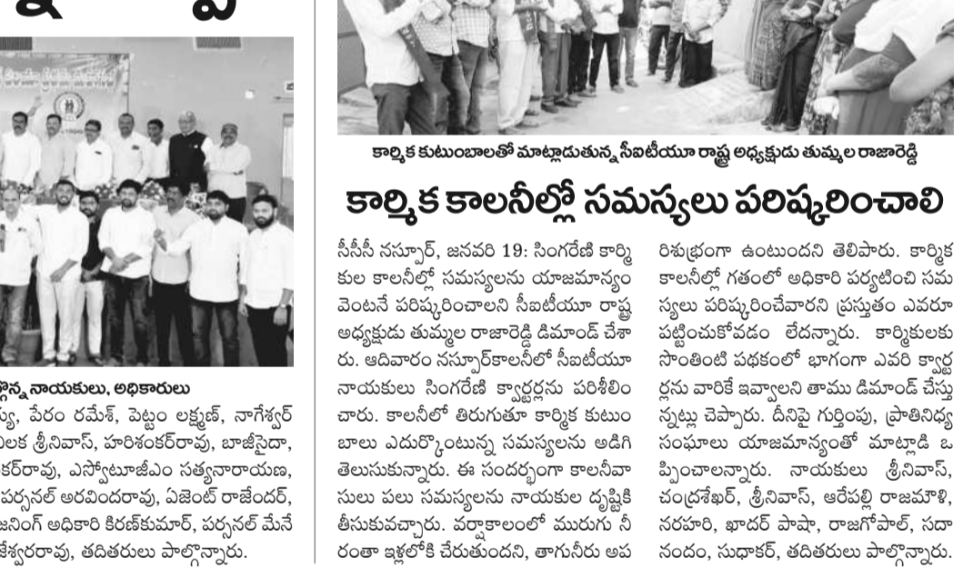
కార్మిక కుటుంబాలలో మాట్లాడుతున్న హెచ్.ఎం.ఎస్ నాయకులు, అధికారులు

సింగరేణి బీసీ ఎంపి యాని వెల్లెట్ అసోసియేషన్ సమావేశంలో పాల్గొన్న నాయకులు, అధికారులు డిమాండ్ చేశారు. సింగరేణి యాజమాన్యం 11 ఏరియాల్లో బీసీ లైజింగ్ అధికారికం చేసేలా కార్యాలయాల ఏర్పాటు చేయాలని, జీఎం కార్యాలయంలో జ్యోతిబా పూలే విగ్రహాల ఏర్పాటు చేయాలన్నారు. శ్రీరాంపూర్ ప్రగతి స్టేడియానికి పూలే పేరు పెట్టాలని