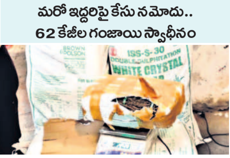
మరో ఇద్దరు సేవకుని సమాహారం 62 కేజీల గంజాయి సాఫ్ట్ క్రాస్టల్స్