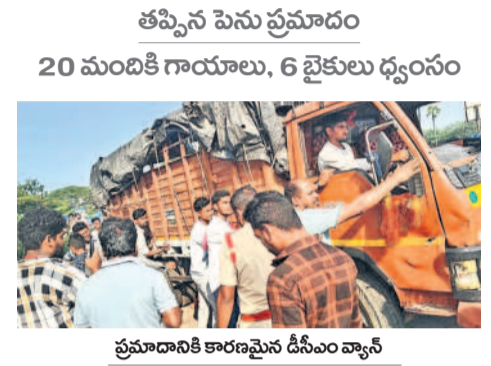
ప్రమాదానికి కారణమైన డీసీఎం వ్యాన్

అదుపు తప్పి గుంతలో పడిన డీసీఎం వాహనం. అదుపు తప్పి గుంతలో పడిన డీసీఎం వాహనం. అదుపు తప్పి గుంతలో పడిన డీసీఎం వాహనం.