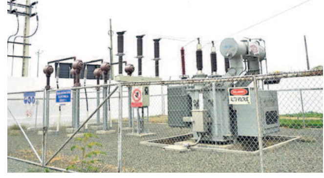
తగ్గని కాలంలో రెండు లక్షల కొద్దే కనెక్షన్లు వచ్చాయి.

సెంట్రల్ డిమాండ్, జనవరి 19 (నవస్వ తెలంగాణ): సాధారణంగా చలికాలంలో విద్యుత్ వినియోగం తగ్గుతుంటుంది. కానీ ఇందుకు భిన్నంగా ఈసారి గ్రేటర్ చలి ఎక్కువగానే ఉన్నా విద్యుత్ వినియోగం మాత్రం పెరుగుతూ ఉన్నది. 2023లో గ్రేటర్ వ్యాప్తంగా 50 నుంచి 55 మిలియన్ యూనిట్ల వరకు విద్యుత్ డిమాండ్ నమోదయ్యాయి.. గత రెండు నెలలుగా ప్రతిరోజూ 60-65 మిలియన్ యూనిట్ల వరకు విద్యుత్ డిమాండ్ నమోదవుతున్నది. 2023లో గ్రేటర్ చలి పరిధిలో విద్యుత్ వినియోగం వార్షిక సగటు డిమాండ్ 2917 మెగావాట్ల నుంచి 2024లో 3218 మెగావాట్లకు పెరిగింది. వృద్ధి కూడా 10.18 శాతం నమోదైంది. రాష్ట్ర వ్యాప్తంగా గత డిసెంబర్ 19 నుంచి రాష్ట్ర గొప్ప స్థాయిలో 257 మిలియన్ యూనిట్ల వినియోగం గమనించారు. 2023లో ఇదే సమయానికి 217 మి.యూ.లే ఉన్నది. రోజూ ఏకంగా 40 మిలియన్ యూనిట్ల డిమాండ్ పెరగడంతో డిసెంబర్ అంతటా అధికంగా అధికారాలు చెబుతున్నారు. ఒక్క గ్రేటర్లోనే గతం కంటే అదనంగా 200 మెగావాట్ల డిమాండ్ పెరిగింది. నగరంలో పారిశ్రామిక, గృహ వినియోగం వల్ల ఈ డిమాండ్ అధికమైంది అధికారాలు అంచనా వేస్తున్నారు. నగర పరిధిలో 2024 డిసెంబర్ నాటికి 62.92 లక్షల కనెక్షన్లు ఉన్నాయి. 2023లో 60.28 లక్షలు ఉన్నాయి. సంవత్సరానికి 2.64 లక్షల కనెక్షన్లు అధికంగా వచ్చాయి.