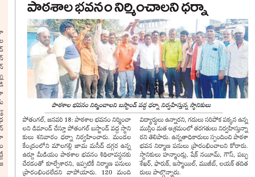
పాఠశాల భవనం నిర్మించాలని బస్టాండ్ వద్ద ధర్మా నిర్వహిస్తున్న స్థానికులు