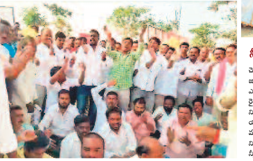
నీటి కోసం లిలే బీక్షలు