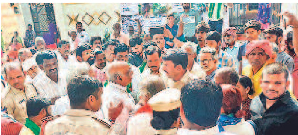
మా భూములు మాకేనని..

'మా భూములు మాకే కావాలి.. ఫార్మాసీటీ కోసం భూములు ఇచ్చేది లేదు' అని రైతులు తెగిన చెప్పారు. ఫార్మాసీటీ వ్యతిరేక పోరాట సమితి ఆధ్వర్యంలో రంగారెడ్డి జిల్లా యాచారం మండలం నానకొనగరిలో శనివారం నిర్వహించిన సదస్సు వద్దకు వచ్చిన పోలీసులతో ఇలా వాగ్వాదానికి దిగారు.