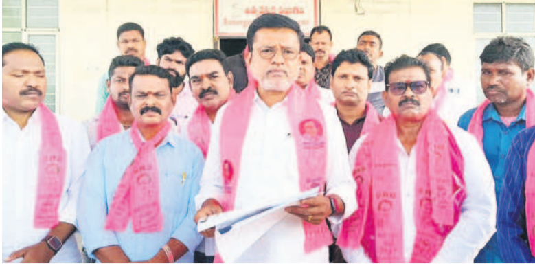
మాట్లాడుతున్న మాజీ ఎమ్మెల్యే పుట్ట మధుకర్