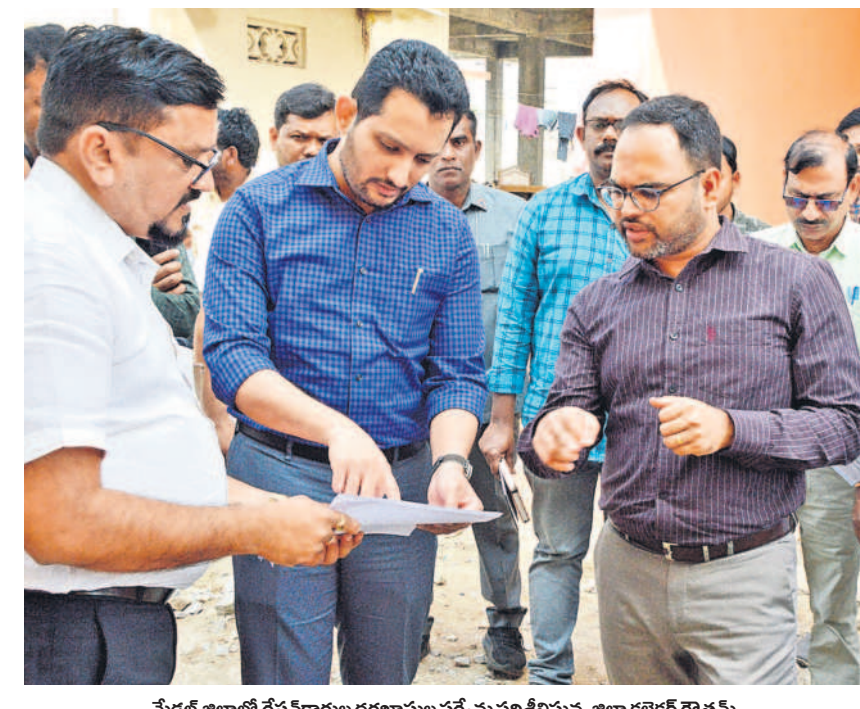
మేధూల్ జిల్లాలో రేషన్ కార్డుల దరఖాస్తుల సర్వే పరిశీలనను జిల్లా కలెక్టర్ గౌతం

ఇందిరవల్ల ఇండ్ల పథకం కింద దారిద్ర్యరేఖకు దిగువన ఉన్న గృహాలు, ఇండ్ల లేనివారు, నిర్మాణానికి స్థలం ఉన్నవారు, పూరి గుడిసెలో ఉన్నవారు, అద్దె ఇండ్లలో నివాసం ఉన్నవారు అర్హులుగా ఎంపిక చేయనున్నట్లు వేర్పాటుగా, భూమిలేని వ్యవసాయ కూలీలు, పారిశుధ్య కార్మికులు, దివ్యాంగులకు మొదటి ప్రాధాన్యం ఇస్తామని అధికారులు స్పష్టం చేస్తున్నాయి. అదరణలో ఎంత వరకు అమలు సాధ్యమవుతుందన్న దానిపై అనుమానులున్నాయి. జిల్లాలో మొదటి విడ