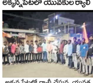
అక్కసపేటలో ర్యాలీ చేస్తున్న యువత