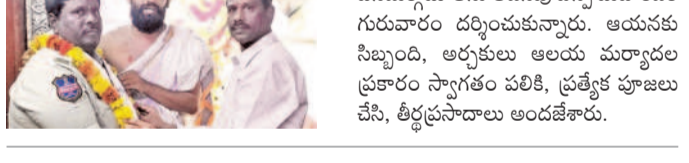
పాపన్నపేట, జనవరి 16: ఏడుపాయల వనదుర్గామాతను అదనపు ఎస్సీ మహేందర్ గురువారం దర్శించుకున్నారు. ఆయనకు సిబ్బంది, అర్చకులు అలయ ముర్యాదల ప్రకారం స్వాగతం పలికి, ప్రత్యేక పూజలు చేసి, తీర్థప్రసాదాలు అందజేశారు.