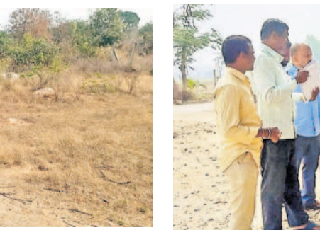
కొడిపల్లి: లింగంపల్లిలో సర్వే నిర్వహిస్తున్న రెవెన్యూ అధికారులు