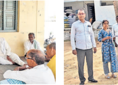
శివంపేట: పెద్దగొట్టి ముక్కలో సర్వే చేస్తున్న అధికారులు