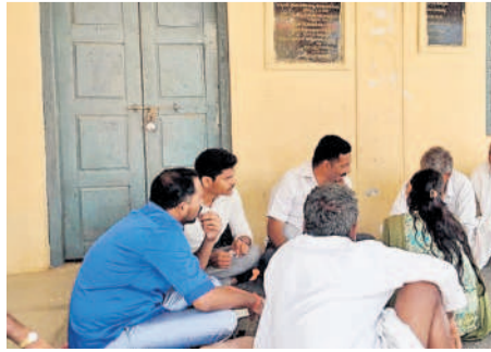
నర్సాపూర్: రాంపంద్రాపూర్ లో రైతు భరోసా సర్వే నిర్వహిస్తున్న ఆర్ఐఎ సిద్దిరాములు