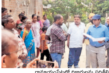
రామాయంపేటలో లిక్కార్లును పరిశీలిస్తున్న కలెక్టర్