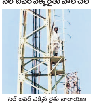
సెల్ టవర్ ఎక్స్ట్రా రైతు వాల్ చల్

పదో తరగతి పరీక్ష ఫీజు చెల్లింపును గుర్తు పెంచు మెడక్ మున్సిపాలిటీ, జనవరి 16: మార్చిలో జరిగే పదో తరగతి పరీక్షలకు రెగ్యులర్, ఫైవేట్ విద్యార్థులకు తక్కువ ఫీజు ద్వారా ఫీజు చెల్లింపును గుర్తు పెంచును. ఫీజు డిమాండ్ చేసిన తర్వాత గుర్తు పెంచును. ప్రభుత్వం తరఫున రూ.22వ తేదీలోగా చెల్లించాలన్నారు.