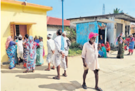
గవ్వలపల్లి పోస్టాఫీసు వద్ద పంచాయతీ కోసం బారులుబీరిన వృద్ధులు, దివ్యాంగులు

ప్రభుత్వం నుంచి ఎలాంటి ఆదేశాలు రాలేదు కొత్త పంచాయతీ సంబంధించి ఇప్పటి వరకు ప్రభుత్వం నుంచి ఎలాంటి ఆదేశాలు రాలేదు. ప్రస్తుతం ఇందిరమ్మ ఇండ్ల సర్వే కోసం సాగుతున్నది. ఆ తర్వాత పంచాయతీ మంజూరు యొక్క అవకాశం ఉంది. జిల్లా వ్యాప్తంగా ఇప్పటికే పంచాయతీ కోసం దరఖాస్తులు వస్తున్నాయి. ఇప్పటికే జిల్లాలో 1,13,933 మంది పంచాయతీదారులు ఉన్నారు. వీరికి ప్రతి నెలా రూ. 25.53 కోట్లు పంపిణీ చేస్తున్నారు. - శ్రీనివాసరావు, డిఆర్డీవో పీడి, మెడక్