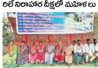
లలే నారావర దీక్షలో మహిళలు