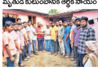
మృతుడి కుటుంబానికి ఆర్థిక సాయం