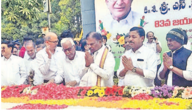
జైపాల్ రెడ్డి సమాధి వద్ద నివాళులర్పిస్తున్న ప్రజాప్రతినిధులు, నాయకులు