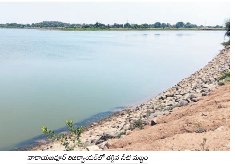
నారాయణపూర్ రిజర్వాయర్ లో తగ్గిన నీటి మట్టం