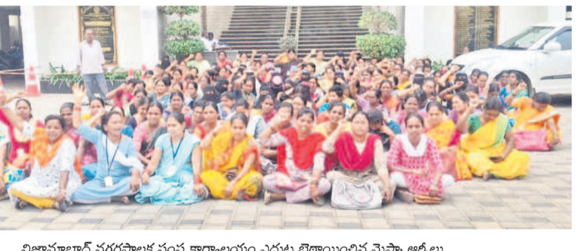
నిజామాబాద్ నగరపాలక సంస్థ కార్యాలయం ఎదుట బైకాయిందిన మెప్పా ఆర్డీలు