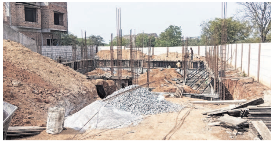
శంషాబాద్ గొల్లవానికుంటలో చేపడుతున్న భాలీ సెల్లార్ నిర్మాణం

పట్టణంలోని సర్వే నంబర్ 104లో గొల్లవానికుంట 22 ఎకరాల 23 గుంటల విస్తీర్ణంలో ఉంది. యాభై ఏళ్ల కిందట రైతులు తమ సొంత పొలాల్లో దీనిని ఏర్పాటు చేసుకోవడంతో ఈ కుంట గ్రామ మ్యాపుల్లో ఉంది. అదే ವಿಧಂಗ್ ಕಾಟಿಲ್ಲರ್ಟ್ ಮೀಡ್ ನಮ್ಮಾರೆಂದಿ. ರವನ್ನು, ఇరిగేషన్ రికార్డుల్లో మాత్రం ఈ కుంటలేదు. అయితే ఈ కుంట భూమి మొత్తం పట్టాభూములు కావడంతో కాల్మక మేణా నీళ్లు తగ్గిపోవడం ఈ భూమిపై పలు లావాదేవీలు క్రయవ్యికయాలు జరిగాయి. చివరికి ఇక్కడ స్థలాలు కొన్న వారు కాస్తా విల్లాలు, ఇండ్ల నిర్మాణం చేసుకుంటున్నారు. ఇంకా కొన్ని నిర్మాణాలు జరుగుతున్నాయి. కుంట ఆక్ర మణ జరుగుతున్న తీరుపై హైడ్రాకు ఫిర్యాదులు రావడం తో ఈ నెల 9న కమిషనర్ రంగనాథ్ పరిశీలించారు. చట్ట బద్ధమైన రీతిలో కుంటను స్వాధీనం చేసుకునేందుకు చర్యలు తీసుకుంటామన్నారు. భూములు తానే విక్రయిం