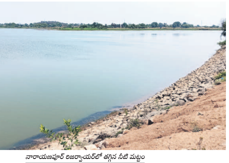
నారాయణపూర్ రిజర్వాయర్ లో తగ్గిన నీటి మట్టం