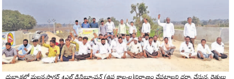
దుబ్బాకలో మల్లన్న సాగర్ 4వ డిస్ట్రిబ్యూషన్ (ఉప కాల్య) నిర్మాణం చేపట్టాలని ధర్మా చేస్తున్న రైతులు

భావం వలన వాయిదా వేసిన దన్నారు. కేటీఆర్ మాత్రం ఈనెల 9వ తేదీన మంత్రి కార్యాలయానికి వెళ్లి విచారణకు పూర్తిగా సహకరించారని సుభాష్ రెడ్డి గుర్తించారు. ఈ కేసు కేవలం రాజకీయ వేధింపులు మాత్రమే అనే విషయాన్ని స్పష్టంగా ఏసీబీ అధికారులకు కేటీఆర్ తెలియజేశారన్నారు. ఎఫ్ఆర్ఎస్ రద్దు చేయాలన్నా విజ్ఞప్తిపై 9వ తేదీన సూచన ప్రాయం నిర్ణయం తీసుకున్నారని, బుధవారం సుప్రీం కోర్టు సలహా మేరకు వెనక్కి తీసుకున్నారని సుభాష్ రెడ్డి పేర్కొన్నారు. కాంగ్రెస్ నాయకులు మాత్రం అప్పీల్ ను కేటీఆర్ వెనక్కి తీసుకోవడం ఎదురు దెబ్బ అని అమాహాన రాజకీయంగా మాట్లాడటం సరికాదన్నారు. నేషనల్ హెరాల్డ్ కేసులో సీనియరాంధీ, రాహుల్ గాంధీ సుప్రీం కోర్టులో తమ అప్పీళ్లను వెనక్కి తీసుకోలేదా ఆ సుభాష్ రెడ్డి ప్రశ్నించారు. కాంగ్రెస్ నేతలు చరిత్రను గుర్తుంచుకోవాలని సూచించారు.