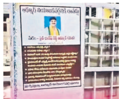
నందివేట్ లోని ఓ ప్రధాన కూడలి వద్ద వెలిసిన పోస్టర్