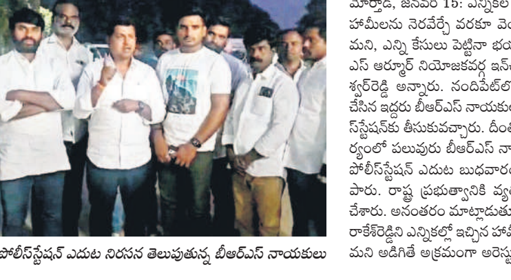
బాల్కొండ పోలీస్ స్టేషన్ ఎదుట నిరసన తెలుపుతున్న బీఆర్ఎస్ నాయకులు

కేంద్రంగా జాతీయ పసుపు బోర్డు ఏర్పాటు అయినందుకు పసుపు రైతులకు శుభాకాంక్షలు తెలిపారు. పసుపుబోర్డు ఏర్పాటు కోసం రైతుల సుదీర్ఘ పోరాటం చేశారని, అలాంటి ఎంపీ కవితమ్మ నాయకత్వంలో బీఆర్ఎస్ ఎమ్మెల్యేలు అందరూ అనేక సార్లు సంబంధిత కేంద్ర మంత్రులు, ప్రధాన మంత్రిని కలిశారని గుర్తు చేశారు. పసుపుబోర్డు ఏర్పాటు కోసం కవిత పార్లమెంట్ లో గళమెత్తడం లాంటి పారాటాల ఫలితంగా పసుపుబోర్డు ఏర్పాటు కల ఫలితమిందిన పేర్కొన్నారు. పసుపుబోర్డు ఏర్పాటు కోసం పసుపు పండించే రాష్ట్రాల సీఎంలతో మాట్లాడి ఎమ్మెల్యేలతో కలిసి కేంద్రానికి లేఖలు ఇప్పించడం కోసం కవిత చేసిన కృషిని ఎమ్మెల్యే వేముల గుర్తు చేశారు. ఇప్పటికైనా పసుపు కనీసమద్దతు ధర