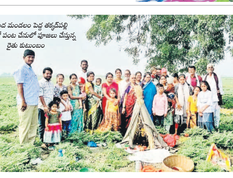
బిచ్చంద మండలం పెద్ద తక్కవల్లి గ్రామంలో పంట చేసుకోవడానికై రైతు కుటుంబం

పసుపు బోర్డు ప్రారంభం ఖలీల్ వాడి, జనవరి 15: నిజామాబాద్ కేంద్రంగా పసుపు బోర్డును కేంద్ర వాణిజ్య పరిశ్రమల శాఖ మంత్రి పీయూడి గోయల్ నిజామాబాద్ ఎంపీ ధర్మపురి అర్పిందీతో కలిసి ఢిల్లీ నుంచి మంగళవారం చర్చుపల్లె ప్రారంభించారు. ఈ సందర్భంగా కేంద్ర మంత్రి మాట్లాడుతూ.. నిజామాబాద్ లో పండి పసుపును ప్రత్యేక స్థానం ఉండవచ్చు. బోర్డు ఏర్పాటుతో పరిశోధనలు పెరుగుతాయని, అభివృద్ధి పొందే పుంజుకుంటుందని తెలిపారు. బోర్డు చైర్మన్ గా ఎంపీ కవిత పల్లె గంగాపెద్దిపాడు ఎంపీ