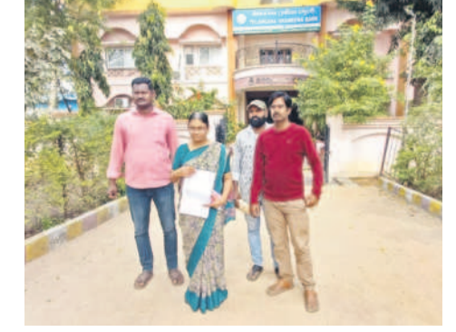
బ్యాంక్ ఎదుట నిరసన తెలుపుతున్న బాధితురాలు