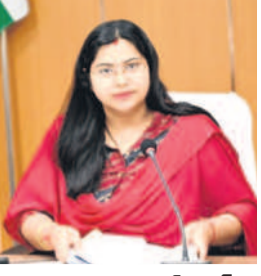
మాట్లాడుతున్న నిర్మల్ కలెక్టర్ అభిజిత్ అజనన్

నిర్వహణ వైస్ చీఫ్, జనవరి 15 : రాష్ట్ర ప్రభుత్వం ప్రతిష్టాత్మకంగా ఆమలు చేయనున్న రైతు భరోసా, ఇందిరమ్మ ఇళ్లు, కో క్లబ్ రివీల్యూషన్ జాబ్, ఇందిరమ్మ ఆర్మీ ట్రోఫీ పథకాలకు సంబంధించి అర్హుల గుర్తింపు ప్రక్రియ పూర్తి చేసి గ్రామాలు, వార్డుల్లో గ్రామసభలు పక్కాగా నిర్వహించాలని కలెక్టర్ అధికారుల ఆదేశాలను అందించారు. గణ తంత్ర దినోత్సవాన్ని పురస్కరించుకుని ఈ నెల 28 నుంచి ప్రైవేట్ కాలను ఆమలు చేయాలని ప్రభుత్వం సంకల్పించిన నేపథ్యంలో చేపట్టాల్సిన చర్యలపై అధికారులతో మంగళవారం కలెక్టర్ జూమ్ మీటింగ్ ద్వారా దిశానిర్దేశం చేశారు. గ్రామస్థాయిలో అర్హులకు పథకాలు అందించు తరహాల్లో, ఎంపీటీసీలు, వ్యవసాయ, పౌర సరఫరాల అధికారులు ఏపీఎంలు, అధికారులతో సమన్వయం జరుపాలని ఏర్పాటు చేయాలన్నారు. ప్రభుత్వ పథకాల అమలులో సందేహాలన్నట్లుంటే కలెక్టర్ కంట్రోల్ రూం నంబర్లను సంప్రదించాలన్నారు. ఈ జూమ్ కాన్ఫరెన్స్ లో అదనపు కలెక్టర్ల పైజాన్ అహ్మద్, కిశోర్ కుమార్, నిర్మల్, జైంసా అధీశాఖ రక్షణల్యాబ్, కోమల్ రెడ్డి పాల్గొన్నారు.