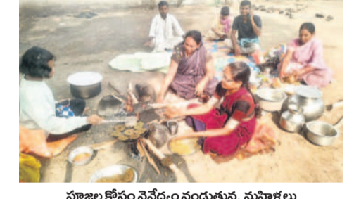
పూజల కోసం నైవేద్యం పండుకున్న మహిళలు