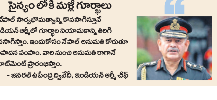
పైన్యం లోకి మళ్లీ గూర్ఖాలు నేపాల్ సార్వభౌమత్వాన్ని కొనసాగిస్తూనే ఇండియన్ ఆర్మీలో గూర్ఖాల నియామకాన్ని తిరిగి కొనసాగిస్తాం. ఇందుకోసం నేపాల్ లనుమతి కోరుతూ ప్రతిపాదన పంపాం. వారి నుంచి లనుమతి రాగానే లక్షాధికారి సైరంభిస్తాం. - జనరల్ ఉపేంద్ర దివెంగి, ఇండియన్ ఆర్మీ ఛీఫ్

అదే తరహాలో తెలుగు సినీమా ఇండస్ట్రీని భయ పెట్టి లొంగదీసుకున్నారా? తనకు అనుకూలమైన వ్యక్తులకు ఒకలా, వ్యతిరేకులను మరోలా లోకే వస్తున్నారన్న విమర్శలు వినిపిస్తున్నాయి. తెలంగాణ పిల్లల డెవలప్ మెంట్ కార్యదేష్ నైర్మణికా ఉన్న దీలరాజు చిత్రానికి ఆయాజిత లబ్ధి కలిగిపోతూ ప్రభుత్వం వ్యవహరిస్తున్నది. ఇది కచ్చితంగా క్విడ్ ప్రో కో కిందకే వస్తుందని బీఆర్ఎస్ నేతలు అలోచిస్తున్నారు. ఇండస్ట్రీ పెద్దలు కలవకముందు చట్టం, న్యాయం, అందరికీ సమానమే అన్న రేవంత్ రెడ్డి, వాళ్ల కలిశాక పరిస్థితులు ఎందుకు మారాయో ప్రజలకు సమాధానం చెప్పాలి. (నాసకర: అభ్యుక్తులు, బీఆర్ఎస్ అగ్రస్థిరయ)