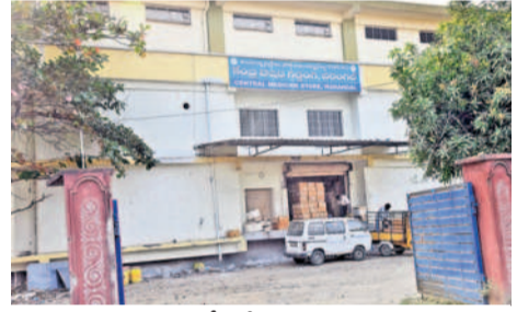
వరంగల్లోని కేంద్ర బెజ్జెడ్ గిడ్డంగి

వరంగల్, జనవరి 15 (నమస్తే తెలంగాణ ప్రతినిధి) : ప్రభుత్వ దవాఖానలకు మందుల సరఫరా ప్రక్రియ గండరగోళంగా మారింది. సెంట్రల్ డ్రగ్ స్టోర్ నుంచి ప్రాథమిక ఆరోగ్య కేంద్రాలకు బెజ్జెడలు చేరవేసే వ్యవస్థ గాడి తప్పింది. ఫలితంగా ప్రజలకు అవసరమైన మందులు సకాలంలో అందక ఇబ్బంది అవుతున్నది. ప్రభుత్వ దవాఖానల్లో అత్యవసర మందుల కొరత ఉంటున్నది. పీహెచ్సీలకు అవసరమైన వ్యాక్సిన్లు, యాంటీబయోటిక్ వంటి అత్యవసర మందులు అందడం లేదు. చిన్న పిల్లలకు ప్రతినెలా ఇచ్చే వ్యాక్సిన్లు పీహెచ్సీల్లో అందుబాటులో ఉండడం లేదు. గ్రామీణ ప్రాంతాల్లో వైద్యసేవలు అందించే పీహెచ్సీ సిబ్బంది స్వయంగా సెంట్రల్ డ్రగ్ స్టోర్ కు వెళ్లి మందులు తీసుకుపోవాల్సి వస్తున్నది. రెండు, మూడు రోజులకు ఒకసారి ఇలా డ్రగ్ స్టోర్ కు వెళ్లడం, అటు పీహెచ్సీలో సేవందించడం.. ఇలా రెండు రకాల పనులతో పీహెచ్సీలో ఆశించిన మేరకు వైద్యం అందని పరిస్థితి నెలకొంది. పీహెచ్సీల్లో మందుల కొరత సమస్య రోజురోజుకూ తీవ్రమై రోగులకు శాశ్వత మారు తప్పింది.