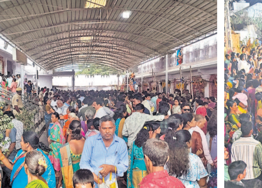
కొత్తకొండ ఆలయంలో కీర్తనల సభ

కాలింగ్ వ్యవస్థ లేదు కొత్తగా ఏర్పాటు చేసిన డ్రగ్ స్టోర్లలో మందులను నిల్వ చేసే వ్యవస్థ అధ్వానంగా ఉన్నది. మందులను నిల్వ చేసే పరిస్థితి లేకపోవడంతో ప్రాథమిక ఆరోగ్య కేంద్రాలకు, ఇతర ప్రభుత్వ ఆస్పత్రులకు మందులు అందడం లేదు. సెంట్రల్ డ్రగ్ స్టోర్ నుంచి మారుమూల ప్రాంతాల్లో పీహెచ్సీలకు సకాలంలో మందులను రవాణా చేసిన తప్పాలా శాఖ సేవలను ఏడాది నుంచి వినియోగించుకోవడం లేదు. దీని స్థానంలో వాహనాలను అడ్డంకు తీసుకొని పీహెచ్సీలకు సరఫరా చేయాలని వైద్య ఆరోగ్య శాఖ ఆదేశాలిచ్చింది. అంతేకాక సరఫరా చేసిన వాహనాల బిల్లు