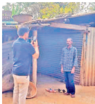
వెంకటాపురం జి.పీ. లక్ష్మీపురంలో సర్వే చేస్తున్న అధికారులు

బయ్యారం, జనవరి 15 : బయ్యారం మండలం వెంకటాపురం, అల్లిగూడెం పంచాయతీలో ఇందిరమ్మ ఇళ్ల సర్వే ప్రారంభమైంది. ఇందిరమ్మ ఇళ్ల సర్వే యావత్ ఈ రెండు గ్రామ పంచాయతీల్లోని ఎనిమిది గ్రామాలు లాగిన్ కాకపోవడంతో సర్వే మొదలుకాలేదు. ఈ క్రమంలో ప్రజలు ఆందోళన చెందుతున్న తీరుపై 'ఇందిరమ్మ ఇళ్ల యావత్.. ఆ ఊళ్లు మిస్' శీర్షిక కు ఈ నెల 8న 'నమస్తే తెలంగాణ'లో కథనం ప్రచురించింది. దీంతో స్పందించిన జిల్లా యంత్రాంగం అధికారుల దృష్టికి తీసుకోవడంతో సాంకేతిక సమస్యను పరిష్కరించి బుధవారం ఆయా గ్రామాల్లో సర్వే నిర్వహించారు.