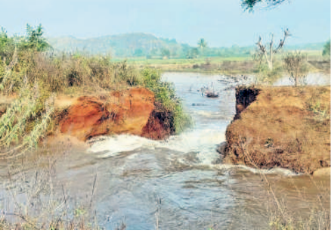
వ్యూహా పోతున్న నీళ్లు

ఇనుగర్ల, జనవరి 15 : ఇనుగర్ల మండలంలోని మీర్యతం గ్రామ పంచాయతీ పరిధిలోని మురికుంటతండా సమీపంలో మంగళవారం ఎస్సారెస్పీ కెనాల్ కాలువకు గండి పడింది. భారీగా నీళ్లు పూర్ణ పోవడంతో అధికారులు నీటి సరఫరా నిలిపివేశారు. అయితే వెంటనే గండిని పూర్ణ తిరిగి నీళ్లు అందించాలని లేకపోతే తమ పంటలు ఎండిపోతాయని రైతులు ఆవేదన వ్యక్తం చేశారు. కాలువలో ఉన్న చెత్తాచెదారం, చెత్తకొమ్మల లాంటివి తొలగించడపోవడం వల్లే తరచూ ఎస్సారెస్పీ కెనాల్ కు గండ్లు పడుతున్నాయని రైతులు