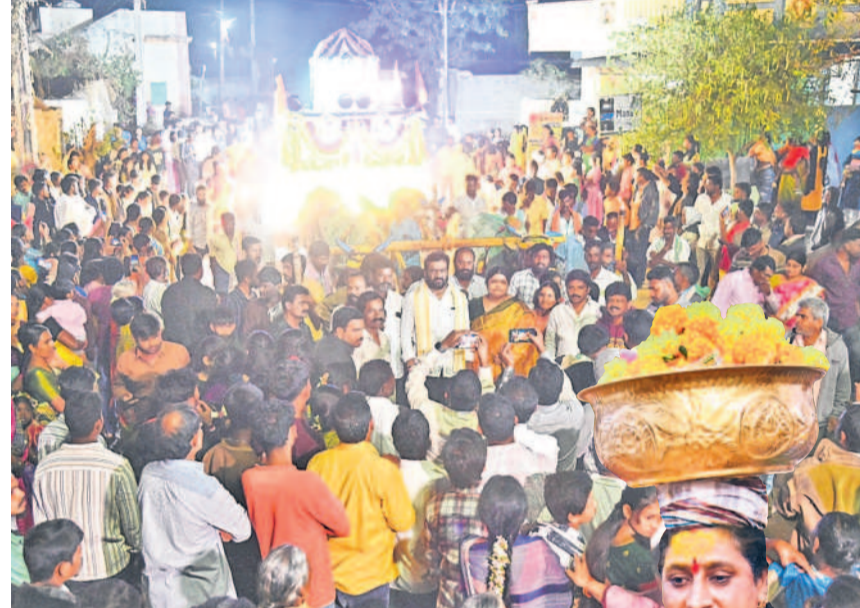
బనవోలులో పెద్ద బండితో వస్తున్న మాల్వేని పంఠాలు