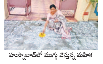
హుస్సాబాద్ లో ముగ్గు వేస్తున్న మహిళ