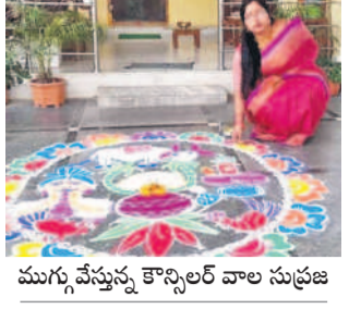
ముగ్గు వేస్తున్న కొన్ని వాల సుప్రజ

హుస్సాబాద్ లో, జనవరి 13: భోగి పండుగ వేళ వాకిల్లు రంగురంగుల ముగ్గులతో నిండిపోయాయి. హుస్సాబాద్లో సోమవారం తెల్లవారుజాము నుంచే మహిళలు తమ వాకిళ్లలో భోగి పండుగ విశిష్టతను తెలిపేవిధంగా ముగ్గులు వేశారు. ముగ్గుల్లో రంగులు నింపడంతో వాకిళ్లు అకట్టుకున్నాయి.