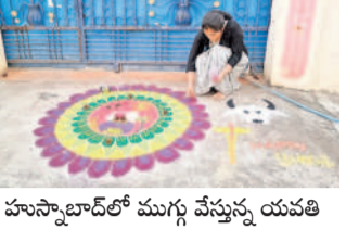
హుస్సాబాద్ లో ముగ్గు వేస్తున్న యువతి