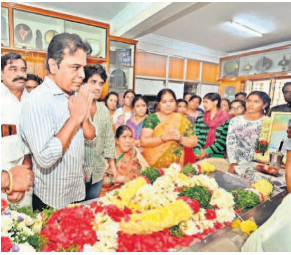
మాజీ ఎంపీ మంద భౌతికకాయం వద్ద నివాళులర్పిస్తున్న కేటీఆర్