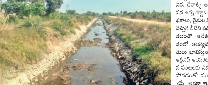
నీళ్లు అందకపోవడంతో ఆర్టీఎస్ ప్రధాన కార్యకర్తల అడుగుంటిన నీళ్లు

అయి. జనవరి 13 : కర్ణాటకలోని ఆర్టీఎస్ ప్రధాన కార్యకర్తల నీటి నిల్వ తగ్గుతుండటంతో ఆర్టీఎస్ ప్రధాన కార్యకర్తల నీటి పారుదల నిలిచిపోయింది. ఈనెల 8వ ఆర్టీఎస్ ఇంటింటిలో భాగంగా నీటి ద్వారా నుంచి నీటిని విడుదల చేసినట్లు చివరికి సమస్య వరకు సీరు చేరలేదు. ఆర్టీఎస్ ప్రధాన కార్యకర్తల నీటి వేరికకు అవసరమైన వరద హెడ్డెస్సు తీర్చి ద్వారా విడుదల కావడం వల్ల ఆర్టీఎస్ ఆనకట్టలో నీటి నిల్వ తగ్గుతూ పోవడంతో రైతులు ఆందోళన చేస్తున్నారు. శని, ఆదివారం