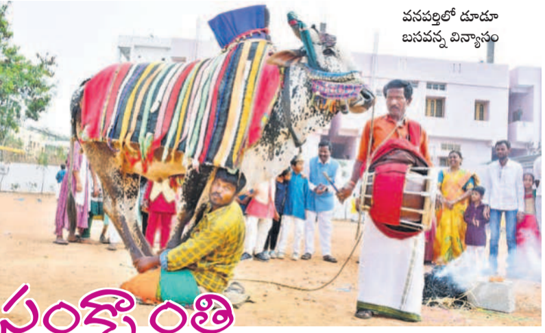
వనపర్తిలో దూడూ బనవన్న విన్యాసం