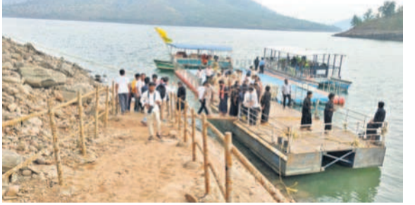
అక్కమహాదేవి గుహలకు వెళ్లేందుకు బోటులో వెళ్తున్న సందర్భములు