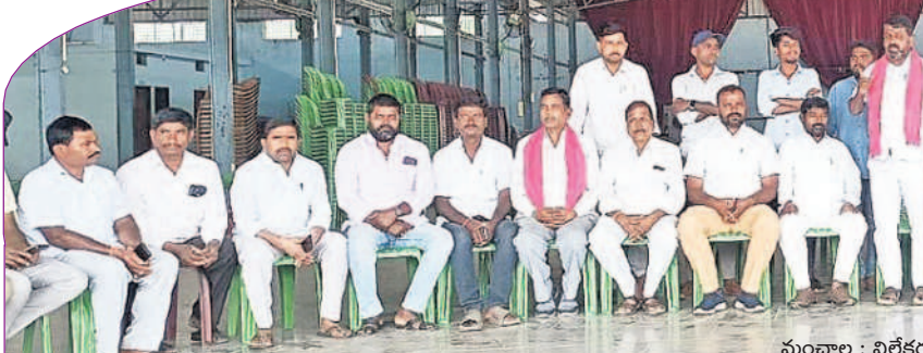
మంచాల : విలేజరుల సమావేశంలో మాట్లాడుతున్న బీఆర్ఎస్ నాయకులు