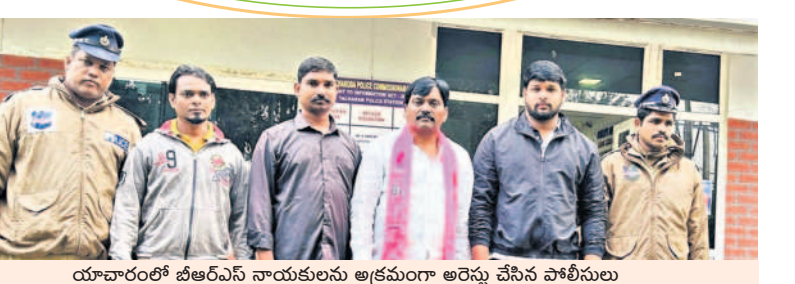
యాచారంలో బీఆర్ఎస్ నాయకులను అక్రమంగా అరెస్టు చేసిన పోలీసులు