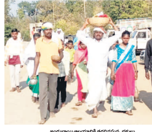
జంగుబాయి ఆలయానికి తరలివచ్చిన భక్తులు

వైభవంగా జంగుబాయి జాతర నేడు అమ్మవారి గుహవర్ణ మహాపూజ, దర్బార్ కుటుంబం ఆసిఫాబాద్ (నమస్తే తెలంగాణ) / కెరమెరి, జనవరి 12 : సహ్యాద్రి పర్వతాల్లోని గుహలో కొలువైన జంగుబాయికి భక్తుల సేవలను పలుకుతున్నారు. ఈ నెల 2న ప్రారంభమైన జాతరకు ఆదివారం పోలింపు తున్నారు. ఆదివారం తెలంగాణ, మహారాష్ట్రల నుండి పెద్ద సంఖ్యలో తరలివచ్చి ప్రత్యేక పూజలు చేశారు. పోచమ్మ, రావుడ్యేవ్, మైసమ్మ వద్ద మేకలు, కోళ్లను బలిచి మొక్కులు తీర్చుకున్నారు. రాత్రంతా అక్కడే బసచేశారు. ఇక సోమవారం అమ్మవారి వద్ద ప్రారంభమైన జాతరకు ఆదివారం పోలింపు తున్నారు. ఆదివారం తెలంగాణ, మహారాష్ట్రల నుండి పెద్ద సంఖ్యలో తరలివచ్చి ప్రత్యేక పూజలు చేశారు. పోచమ్మ, రావుడ్యేవ్, మైసమ్మ వద్ద మేకలు, కోళ్లను బలిచి మొక్కులు తీర్చుకున్నారు. రాత్రంతా అక్కడే బసచేశారు. ఇక సోమవారం అమ్మవారి వద్ద ప్రారంభమైన జాతరకు ఆదివారం పోలింపు తున్నారు. ఆదివారం తెలంగాణ, మహారాష్ట్రల నుండి పెద్ద సంఖ్యలో తరలివచ్చి ప్రత్యేక పూజలు చేశారు.