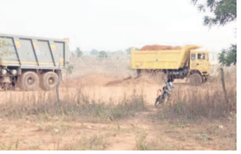
మొరంతో తరలుతున్న లాభిలు

నెన్నెల, జనవరి 12 : కొండరు కాంట్రాక్టర్లు అభివృద్ధి పేరిట అక్రమ మొరం దండాకు తెరలేపారు. యథేచ్ఛగా లాభిలో తరలిస్తూ సర్కారు ఆదాయానికి గండకొడుతున్నారు. ఇంటిమందు పోసుకోవడానికి ట్రాక్టర్ టిప్పర్లకు అనుమతివ్వని మొరం అధికారులు, ఈ విషయంలో చూస్తూ నోరుమెదపకపోవడంపై అనేక అనుమానాలు వ్యక్తమవుతున్నాయి. నెన్నెల మండలం బొప్పారం ప్రాంతంలోని సర్వే నంబర్ 874లో గల ప్రభుత్వ భూమిలోని మొరంను అక్రమంగా తరలింపుకు పాటుచేశారు. బెల్లంపల్లి మండలం చంద్రపల్లి గ్రామానికి వేస్తున్న రోడ్డు కోసం వాడుతున్నారు. మొరం తరలింపు కోసం మొదల కాంట్రాక్టర్ నామమాత్రంగా రెవెన్యూ అధికారులను కలిపి అనుమతులు కావాలని అడిగాడని, వారు ఆర్డీవో, కలెక్టర్ వద్ద అనుమతులు తీసుకోవాలని చెప్పారని తెలిసింది. కానీ నడుచు కాంట్రాక్టర్ ఇవేమీ పాటించకుండా స్థానిక నాయకుల పేరు చెప్పి ప్రతి రోజూ దాదాపు 50 లాభిలో మొరం తరలిస్తున్నాడని స్థానికులు చెబుతున్నారు. ఇదేమిటని ఎవరైనా ప్రశ్నిస్తే నా ఇంటికి తీసుకుపోతున్నా... రోడ్డు కోసం కదా అంటూ నిర్లక్ష్యపు సమాధానమిస్తున్నట్లు వారు తెలిపారు. ప్రభుత్వానికి రావాల్సిన లక్షలాది రూపాయల ఆదాయానికి గండకొడుతున్నా పట్టించుకున్న నాకుడే లెకుండా పోయాడు.