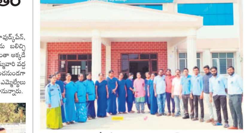
నల్ల బ్యాడ్జిల్తో నిరసన తెలుపుతున్న కాంట్రాక్ట్ కార్మికులు

అపూర్వ సమ్మేళనం దండేపల్లి మండల కేంద్రంలోని జి.ఎస్.ఆర్. పాఠశాలలో 2004-05లో పథక తరగతి చదివిన విద్యార్థులు ఆదివారం అపూర్వ సమ్మేళనం నిర్వహించారు. ఉపాధ్యక్షులు, పూర్వ విద్యార్థులతో రోజంతా సందడి కనిపించింది. విద్యార్థులు కుటుంబ సభ్యుల తో కలిసి వేడుకలకు హాజరయ్యారు. నాటి టీటీ గుర్తులను నెమరేసుకున్నారు. ఎవరెవరు ఎక్కడెక్కడ స్థిరపడ్డారో అడిగి తెలుసుకున్నారు. ఉరితీసం, పాఠశాల అభివృద్ధి కోసం సహకారాన్ని తెలిపారు. అంతరంగ గుర్తులను ఘనంగా నమస్కరించారు. - దండేపల్లి, జనవరి 12