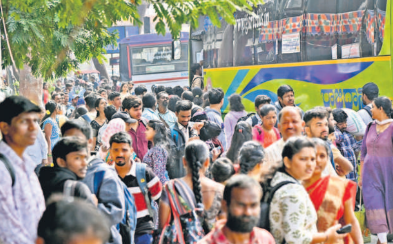
ఉప్పల్ ఎక్స్ రోడ్డులో...