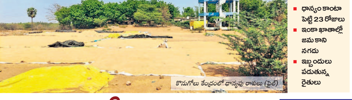
కోసుగోలు కేంద్రంలో ధాన్యపు రాజులు (పైల్)