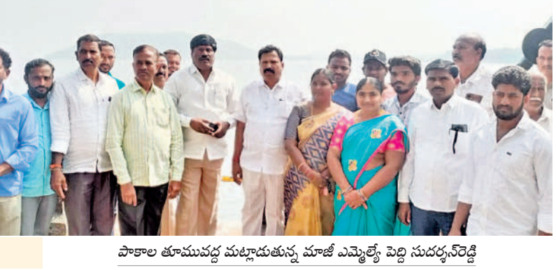
పాకాల తూముపద్ద మట్టాడుతున్న మాజీ ఎమ్మెల్యే పెద్ది సుధర్శన్ రెడ్డి