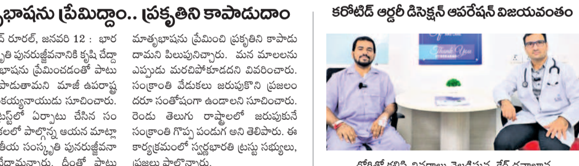
రోగితో కలిసి వివరాలు వెల్లడిస్తున్న కేరీ దవాఖాన సూర్యాపేటలో వైద్యులు

శంషాబాద్ రూరల్, జనవరి 12: భారతీయ సంస్కృతి పునరుజ్జీవనానికి కృషి చేస్తూ మాతృభాషను ప్రేమించడంతో పాటు ప్రకృతిని కాపాడుకోవాలని మాజీ ఉపరాష్ట్రపతి వెంకయ్యనాయుడు సూచించారు. స్వర్ణభారతి ప్రాంతం ఏర్పాటు చేసిన సంత్రాంతి వేడుకలలో పాల్గొన్న ఆయన మాట్లాడుతూ భారతీయ సంస్కృతి పునరుజ్జీవనానికి కృషి చేస్తూన్నారని, దీంతో పాటు మాతృభాషను ప్రేమించి ప్రకృతిని కాపాడుదామని పిలుపునిచ్చారు. మన మూలమనుషులను మరచిపోకూడదని వివరించారు. సంత్రాంతి వేడుకలు జరుపుకొని దారు సంతోషంగా ఉండాలని సూచించారు. రెండు తెలుగు రాష్ట్రాలలో జరుపుకునే సంత్రాంతి గొప్ప పండుగ అని తెలిపారు. ఈ కార్యక్రమంలో సర్వభారతి ట్రస్టు సభ్యులు, ప్రజలు పాల్గొన్నారు.