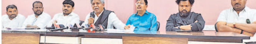
మాట్లాడుతున్న ఎమ్మెల్యే వ్యవస్థాపక మండల కార్యదర్శి

రవీంద్రపూర్, జనవరి 12: తెలంగాణ సాంస్కృతిక సారధి కళాకారులకు ఈ నెల 8న ప్రభుత్వం నుంచి విడుదల చేసిన జీవోను వెంటనే రద్దు చేయాలని ఎమ్మెల్యే వినయ ప్రసాద్ నాయక్ మండల కార్యదర్శిగా పనిచేస్తున్నారు. సారధిలో ఉద్దేశ్యం నిర్వహిస్తున్న కళాకారుల సేవను హరించే విధంగా సర్కూలర్ జారీచేశారని అభిజాన్ నాయక్ అన్నారు. దానిని ఉపసంహరించుకోవాలని కోరారు. ఆదివారం జేపీఆర్ బిర్లా ప్రెస్ కేందర్ ఏర్పాటు చేసిన విలేజ్ కలెక్షన్ మండల కార్యదర్శిగా మాట్లాడుతూ ఆ సర్కూలర్ గురించి సీఎం రేవంత్ రెడ్డి, సాంస్కృతిక శాఖ మంత్రి జూపల్లె కృష్ణారావుకు తెలిపినట్లు ఎమ్మెల్యే వినయ ప్రసాద్ అన్నారు. దీని వెనుక ఉద్దేశ్యం ఏమిటో తెలియకపోయినా, సారధి కళాకారులకు అన్యాయం జరుగుతున్నారని ఆయన వ్యాఖ్యానించారు. ఎన్నో పథకాలకు భంగం తీసుకున్నారని ఆయన అన్నారు. సారధి కళాకారులకు అన్యాయం జరుగుతున్నారని ఆయన వ్యాఖ్యానించారు. ఎన్నో పథకాలకు భంగం తీసుకున్నారని ఆయన అన్నారు.