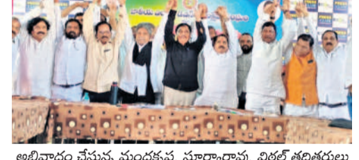
అభివాదం చేస్తున్న మండల కార్యదర్శి, బిఆర్ఎస్ కార్యదర్శులు