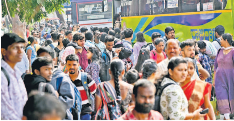
ఉప్పల్ ఎక్స్ రోడ్డులో...