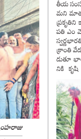
గంగిరెడ్డిల వద్ద సందడి చేస్తున్న మాజీ ఉపరాష్ట్రపతి వెంకయ్యనాయుడు

శంషాబాద్ రూరల్, జనవరి 12: భారతీయ సంస్కృతి పునరుజ్జీవనానికి కృషి చేస్తూ మాతృభాషను ప్రేమించడంతో పాటు ప్రకృతిని కాపాడుకోవాలని మాజీ ఉపరాష్ట్రపతి వెంకయ్యనాయుడు సూచించారు. స్వర్ణభారతి ప్రాంతం ఏర్పాటు చేసిన సంత్రాంతి వేడుకలలో పాల్గొన్న ఆయన మాట్లాడుతూ భారతీయ సంస్కృతి పునరుజ్జీవనానికి కృషి చేస్తూన్నారని, దీంతో పాటు మాతృభాషను ప్రేమించి ప్రకృతిని కాపాడుదామని పిలుపునిచ్చారు. మన మూలమనుషులను మరచిపోకూడదని వివరించారు. సంత్రాంతి వేడుకలు జరుపుకొని దారు సంతోషంగా ఉండాలని సూచించారు. రెండు తెలుగు రాష్ట్రాలలో జరుపుకునే సంత్రాంతి గొప్ప పండుగ అని తెలిపారు. ఈ కార్యక్రమంలో సర్వభారతి ట్రస్టు సభ్యులు, ప్రజలు పాల్గొన్నారు.