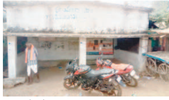
చింతలమానేపల్లిలో నిరుపయోగంగా ఉన్న ప్రయాణ ప్రాంగణం