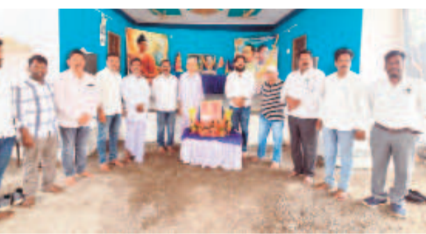
వాంకీడి : నివాళులర్పిస్తున్న నాయకులు