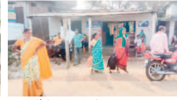
వేర చోట ఉండి బస్సు కోసం వేచిచూస్తున్న ప్రయాణికులు