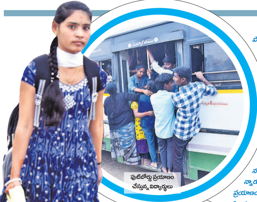
పుట్టిబోధ్య ప్రయాణం చేస్తున్న విద్యార్థిణులు