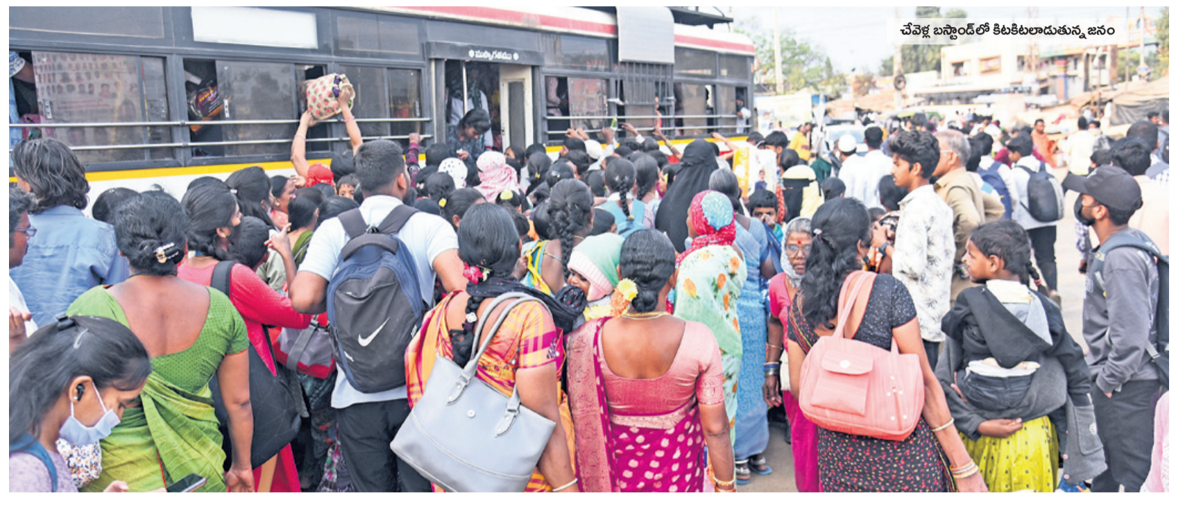
చేవేగ్ బస్టాండ్ లో కిటికీలరాడుతున్న జనం