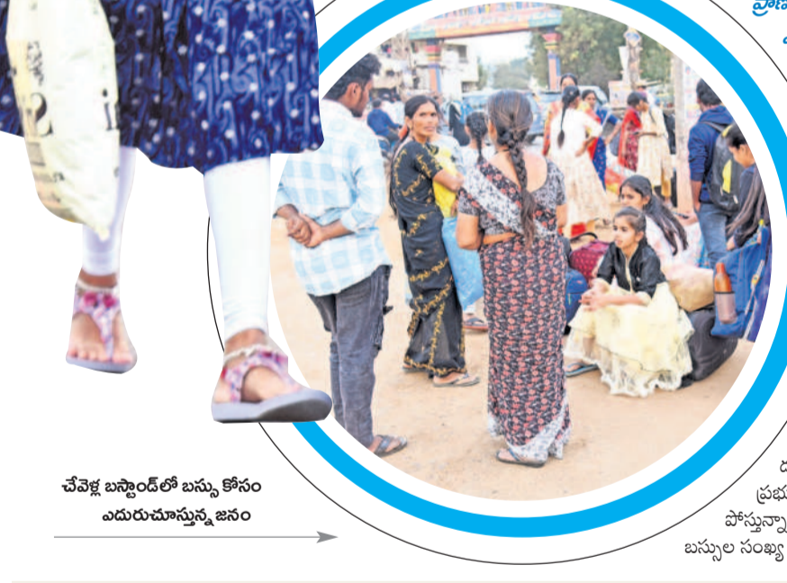
చేవేగ్ బస్టాండ్ లో బస్సు కోసం ఎదురుచూస్తున్న జనం