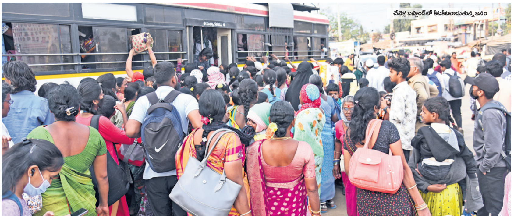
చేవేగ్ బస్టాండ్ లో కిటికీలరాడుతున్న జనం

దేశంలోనే తొలిసారిగా.. దేశంలోనే తొలిసారిగా ఎలివేటెడ్ కారిడార్ విధానాన్ని సీటీటీసీ విధానంలో చేపట్టిన అతిమెట్రో ప్రాజెక్టు హైదరాబాద్ మెట్రోకు చోటు దక్కింది. అయితే నిర్మాణం దశ నుంచి మెట్రో రైలు పట్టాల కేంద్ర వరకు వినియోగించిన సాంకేతికతపై మొదటి నుంచి చర్యలు జరుగుతున్నాయి. అసలు మెట్రో రైలు ప్రయాణం సురక్షితమేనా? రెండు మెట్రో రైళ్ల డీకొంటాయో.. అనే అనుమానం ఇప్పటికీ ఉంది. కానీ గడిచిన ఏడేండ్లలో పెబుతున్నాయి. ఈ వ్యవస్థ ద్వారా ఎలాంటి ప్రమాదం ఉండదని, డీకొనేందుకు అవకాశం ఉండదని మెట్రో వర్గాలు చెబుతున్నాయి.