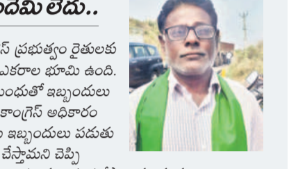
-భూమారెడ్డి, రైతు, ఆనంద్ వారం, జైన్ గో

రైతు ప్రభుత్వమని చెబుతున్న కాంగ్రెస్ ప్రభుత్వం రైతులకు చేసేందేమి లేదు. నాకు మామూలు ఎకరాల భూమి ఉంది. కేసీఆర్ ప్రభుత్వం ఇచ్చిన రైతుబంధుత్వం ఇబ్బందులు తీసుకుంటుంది. కాంగ్రెస్ అధికారి లోకి వచ్చినప్పటి నుంచి రైతులకు ఇబ్బందులు పడుతున్నాయి. రూ. 2 లక్షల రుణమాఫీ చేస్తామని చెప్పి అర్హులకు మొండికేయి చూపింది. ఇప్పుడు రైతుభరోసా ఎకరాకు రూ. 12 అంటున్నారు. అందరూ రైతులకు రైతు భరోసా ఇవ్వాలి.