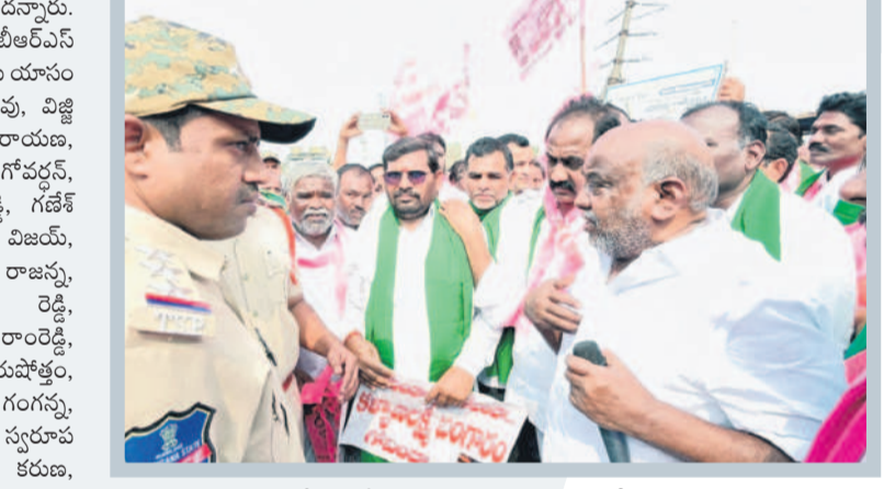
పోలీసులతో మాట్లాడుతున్న మాజీ మంత్రి జోగు రామన్న