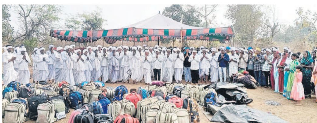
బట్టగూడలో రురికి పూజలు చేస్తున్న మెన్లం వంశీయులు

కాంప్లెక్సులకు ఎదురుగా ఉన్న దుకాణాలను తీసేసేందుకు చర్యలు తీసుకోవాలన్నారు.