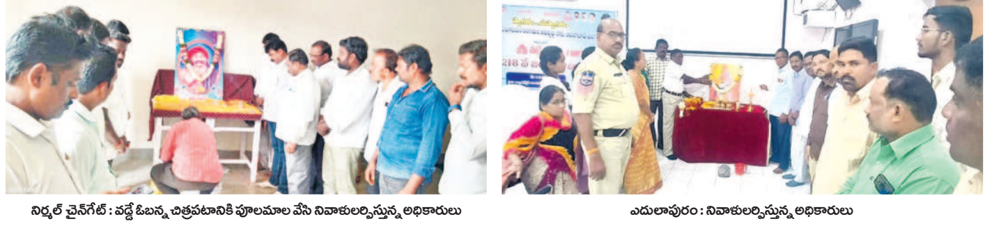
నిర్మల్ చైన్ గోల్ : వడ్డే ఓబన్న చిత్రహాసానికి పూలమాల వేసి నివాళులర్పిస్తున్న అధికారులు