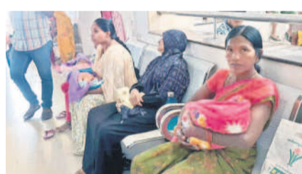
వ్యాక్సిన్ కోసం ఎంసీహెచ్కు వచ్చిన మహిళలు

వేసే ఐపీఏ, పెంటా వ్యాక్సిన్ల కొరత ఉందని, వైద్య సిబ్బంది నుంచి ఒకటి రెండు రోజుల్లో పన్నామం తెలిపారు. వ్యాక్సిన్ కోసం ఎంసీహెచ్ కు రాకుండా అందుబాటులో ఉన్న పీహెచ్ఎస్, యూపీహెచ్ఎస్లకు వెళ్లాలని సూచించారు. పీహెచ్ఎస్లో అన్ని వ్యాక్సిన్లను అందుబాటులో ఉన్నాయన్నారు.