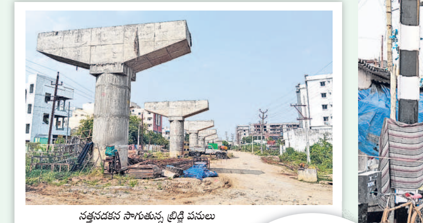
నత్తనడకన సాగుతున్న ట్రిడ్డి పనులు

12 వరంగల్, ఆదివారం 12 జనవరి 2025 JANAGAON