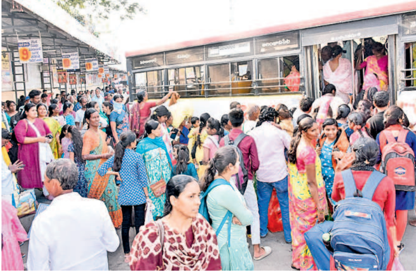
హనుమకొండ బస్టాండ్ లో బస్సు ఎక్కుతున్న ప్రయాణికులు