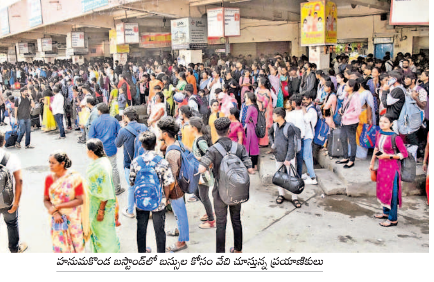
హనుమకొండ బస్టాండ్ లో బస్సుల కోసం వేచి ఉన్న ప్రయాణికులు