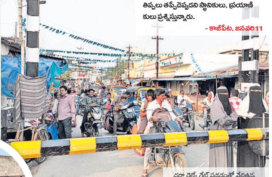
దర్గా రైల్వే గేట్ పడడంతో వేచిఉన్న ప్రయాణికులు, వాహనదారులు