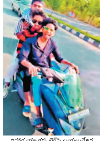
విహారయాత్రకు టైప్ వై బయలుదేరిన యువకులు (ప్రమాదానికి ముందు ఫోటో)

గజ్వల్, జనవరి 11: సరదాగా గడిపేందుకు స్నేహితులు చేసిన విహారయాత్ర విషాదాంతమై అంతిమయాత్రగా మారింది. జీవితంలో తీపిగుర్తుగా ఉండాలని తీసుకున్న సెల్ఫీ వారి బివరి జ్వలకంగా మిలిగిపోయింది. సరదా కోసం జలాశయంలో మునిగినవారు తమ కుటుంబాలను తీవ్ర శోకంధ్రంలో ముంచేశారు. సిద్దిపేట జిల్లా మర్నాడి మండలంలోని కొండపోచమ్మ సాగర్ లో గల్లంతై ఐదుగురు యువకులు మృతిచెందిన ఘటన శనివారం చోటుచేసుకుంది. జీవితంలో స్వీరపడి తమ బాగోగులు చూసుకుంటారని కలలు గన్న తల్లిదండ్రులు కన్నబిడ్డలు విగతజీవులవడాన్ని మానసికంగా తట్టుకోలేకపోయారు. వారి రోదనలు మానీ అందరి కళ్ళు చెమర్చాయి. పోలీసులు, స్టానికరులు → 10వ పేజీలో