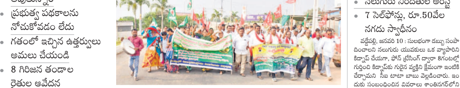
తండాల నుంచి వనపర్తికి పాదయాత్రగా వస్తున్న గిరిజన రైతులు

ఇచ్చిన ఉత్తరాల మేరకు పట్టాలు ఇవ్వాలని ఆర్డీఎస్ కార్యాలయం వరకు పాదయాత్ర చేపట్టారు. ఈ సందర్భంగా గిరిజన రైతులు తమకు జరుగుతున్న అన్యాయాన్ని మొరపెట్టుకున్నారు. కొన్ని దశాబ్దాల నాటి నాటి నీటిని పంపిణీ చేసే అవకాశం ఉండేది. తద్వారా ఉమ్మడి జిల్లాలోని రైతులకు పుష్కలంగా సాగునీళ్లను కూడా అందేవి. కానీ రేవంత్ సర్కారు ఏర్పాట్ల ద్వారా గడివి నా పనులు చేపట్టడం లేదన్న విమర్శలు వినిపిస్తున్నాయి. కావాలనే వివక్ష చూపుతూ పనులు చేపట్టడం లేదని రైతులు ఆరోపిస్తున్నారు. కొల్లూపూర్ మండలం కుడికిళ్ల, పెద్దకొత్తపల్లి మండలం తీర్మానం పట్టి గ్రామాల మధ్య ప్రాజెక్టు ప్రధాన కార్య పనులు వెండిగోల్లో ఉన్నాయి. దీంతో నీళ్లు పారడం లేదు.. ఎగువ ప్రాంతానికి లిజియ్యేషన్ అవకాశం లేకుండా పోయింది. దీనికోసం ఇక్కడి నుంచి తరలింపాలని