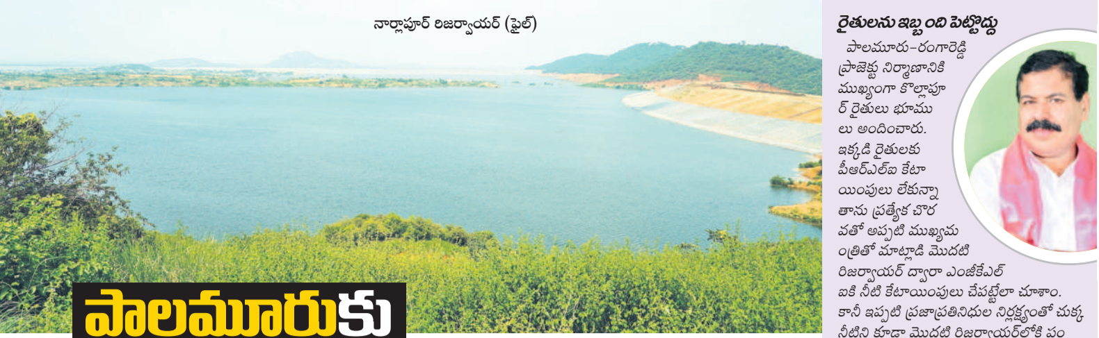
నార్లాపూర్ లిజియ్యేషన్ (పైట)