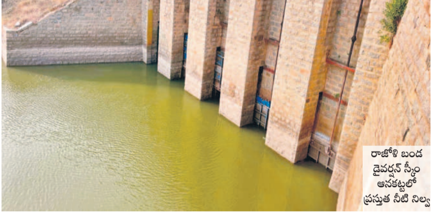
రాజోలి బండ డైవర్ల స్టాండ్ అనకట్లలో ప్రస్తుత నీటి నిల్వ