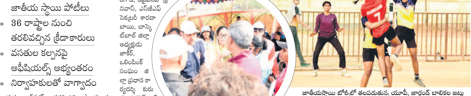
జాతీయస్థాయి టోర్నీలో తలపడుతున్న యూపీ, జార్ఖండ్ బాలికల జట్టు

కోచలు, అఫీషియల్స్ కు విడివిడిగా మైన్ డి.ఎస్. గురుకుల పాఠశాలలో వసతి ఏర్పాటు చేశారు. బిడ్డ స రిగా లేవని, మూత్రాలను కంప్యూటరులోని నిర్వాహకులపై ఆగ్రహం వ్యక్తం చేశారు. దీంతో కొద్ది సేపు మ్యాచ్ ను నిలిపివేశారు. పాఠశాలకు నేటి నుంచి నిలవులు ఉన్నాయని, విద్యార్థులు వెళ్లాలిగా గదులను శుభ్రం చేయాలిగా నిర్వాహకులు సభిస్తున్నారు.