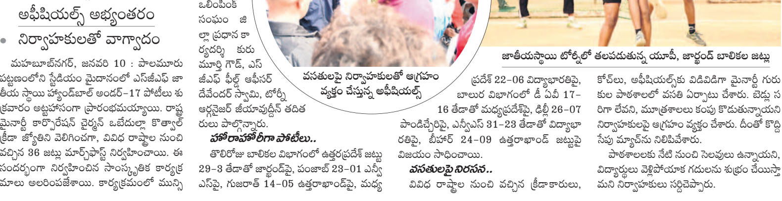
వనపర్తి నిర్వాహకులతో ఆగ్రహం వ్యక్తం చేస్తున్న అభిషియల్స్