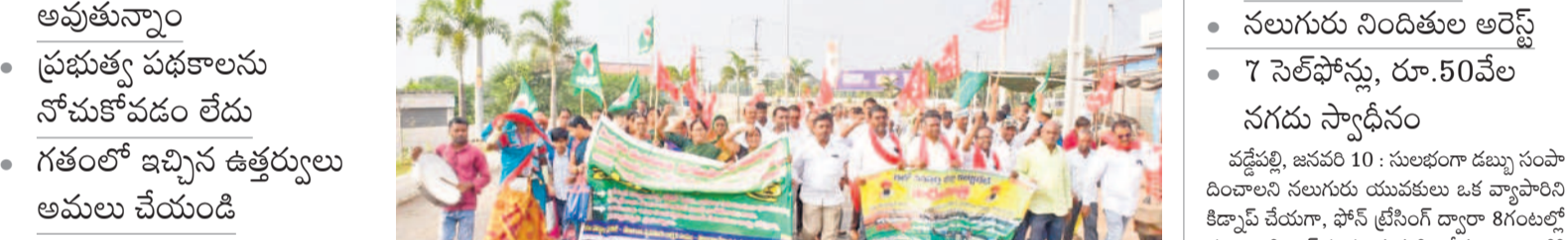
తండాల నుంచి వనపర్తికి పాదయాత్రగా వచ్చిన గిరిజన రైతులు