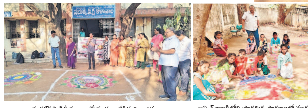
కూకట్‌పల్లి డిగ్రీ కళాశాలలో ముగ్గులు వేసిన విద్యార్థినులు