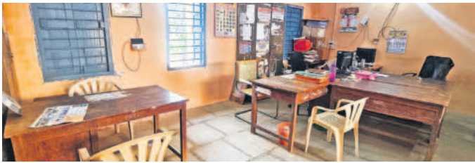
మునిపల్లి మండల పరిషత్ కార్యాలయంలో గురువారం ఉదయం 10 గంటలకు స్వాగతం పలుకుతున్న భోజి కుర్చీలు