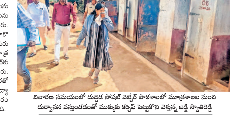
విచారణ సమయంలో దుద్దెడ సోషల్ వెల్ఫేర్ పాఠశాలలో మూత్రశాలను సుందీయ్యాసన చేస్తున్నప్పుడు ముక్కు కల్పిసి పెట్టుకొని వెళ్తున్న జడ్చిలమల పీడి

దవాఖాసలో చికిత్స పొందుతున్న విషయం తెలిసి గురుకుల పాఠశాలను సందర్శించారు. పీడి విద్యార్థులను కొట్టడానికి గల కారణాలను తెలుసుకోని పాఠశాల పరిసర ప్రాంతాలను పరిశీలించి ఉపాధ్యాయులతో మాట్లాడాడు. విద్యార్థులు ఫిజికల్ డైరెక్టర్ వాసు మాకొ డ్దుంటూ రాతపూర్వకంగా రాసివచ్చారు. గురు కుల పాఠశాలలోని న్యూన గణనలు, మూత్ర శాలను సుందీయ్యాసన రావడంతో కర్రలతో పూర్తి సమాచారం అందిస్తామని తెలిపారు. పీడి వాసు బుధవారం విద్యార్థులను కర్రతో కొట్టడంతో బాగా అయి వచ్చాయి. దీంతో విద్యార్థులు వారి తల్లిదండ్రులకు సమాచారం అందించడంతో విషయం బయటకొచ్చింది.