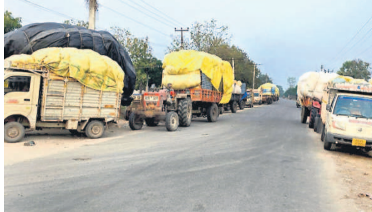
చిట్టాలలో సీసీబి కొనుగోలు కేంద్రం వద్ద పత్తి లోడ్లు

రూ.లక్షా ఒక వేయి నూటపదహారు రూపాయలు అందిస్తూ వచ్చారు. అలా అనేక కుటుంబాలను అప్పుల గండం దాటింపారు. కాగా, అసెంబ్లీ ఎన్నికల సమయంలో అడ్డగోలు హామీలిచ్చిన కాంగ్రెస్. కల్యాణలక్ష్మి షాద్ ముబారక్ అభివృద్ధి కార్యక్రమం పెండ్లికి ముందే తులం బంగారం అదనంగా ఇస్తామని ఊడరగొట్టింది. కానీ, అభివృద్ధిలో వచ్చి ఏడాది దాటినా నేటికీ ఆ పథకం ఊస ఎత్తడం లేదు. 2024 జనవరి నుంచి ఇప్పటివరకు సూర్యాపేట జిల్లాలో దాదాపు 5,520 వివాహాలు జరిగాయి. అందులో 3,362 మంది కల్యాణలక్ష్మి షాద్ ముబారక్ రకం దరఖాస్తు చేసుకున్నారు. వారికి కేసీఆర్ హయాంలోనే ఇచ్చినట్లు లక్షా నూట పదహారు వ్యాజ్య మాత్రమే ఇచ్చారు తప్ప బంగారం ఇవ్వలేదు. అలా ఒక్క సూర్యాపేట జిల్లాకే కాంగ్రెస్ ప్రభుత్వం 33.62 కిలోల బంగారం బాకీ పడింది. మరోవైపు మిగిలిన దరఖాస్తుదారులకు రావాల్సిన నగదు కూడా ఇంకా పెండింగ్ లోనే ఉంది. సర్కారు మోసపూరిత వైఖరిపై మండిపడుతున్న లబ్ధిదారులు ఎన్నికల హామీ మేరకు తులం బంగారం ఇవ్వాలని డిమాండ్ చేస్తున్నారు.