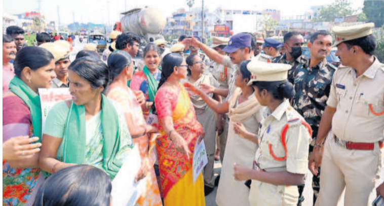
చౌటుప్పల్లో ట్రైపుల్ ఆర్ నిర్వహించిన రాస్తారోకోను అడ్డుకుంటున్న పోలీసులు