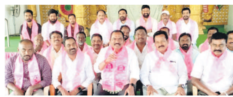
సమావేశంలో మాట్లాడుతున్న మాజీ ఎమ్మెల్యే రవిశంకర్