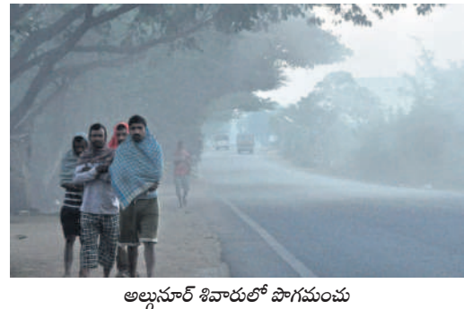
అల్లునూర్ శివారులో పాగమండు

చలి తీవ్రత మళ్ళీ పెరిగింది. రెండు మూడు రోజుల నుంచి ప్రతాపం చూపుతున్నది. కనిపించిన ఉష్ణోగ్రతలు ఏకంగా పదకొండు డిగ్రీలకు పడిపోగా.. గజగజా వణికిస్తున్నది. పొద్దుటా చల్లగాలులు వీస్తుండగా.. ప్రజలు ఇండ్ల నుంచి వెళ్ళలేని పరిస్థితి ఉంటున్నది. కోల్డ్వెల్వెట్ మరీ దారుణంగా ఉన్నది. గురువారం 10.8 డిగ్రీలుగా నమోదు కాగా, ప్రజలు ఇబ్బందులు పడ్డారు. ఉదయం సాయంత్రం వేళల్లో చలిమంటు కాగుతున్నారు.