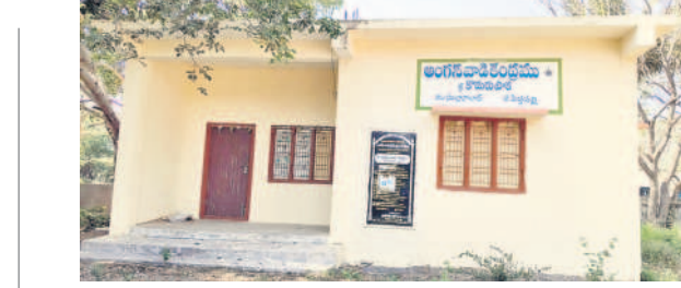
కొడురుపాకలో తాళం వేసి ఉన్న అంగన్ వాడీ కేంద్రం

జగిత్యాల రూరల్, జనవరి 9: అర్జత్, వైద్యకర్మమున్న సిగ్నల్ కార్మికులకు తెలంగాణ ఓపర్టిన్ మ్యాన్ పవర్ కంపెనీ లిమిటెడ్ టామ్ కామ్ కార్మిక, ఉపాధి క్షేత్ర, కార్యాలయ శాఖ కింద సింగపూర్ లో ఉద్యోగవకాశాలు కల్పిస్తున్నదని జగిత్యాల జిల్లా ఉపాధి కల్పన అధికారి సత్యగురువారం ఒక ప్రకటనలో పేర్కొన్నారు. సింగపూర్ లో మేషన్, షీట్ ఫిట్టర్ల కోసం ఖాళీలు ఉన్నాయని తెలిపారు.