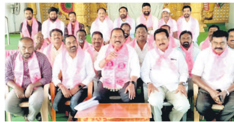
సమావేశంలో మాట్లాడుతున్న మాజీ ఎమ్మెల్యే రవిశంకర్