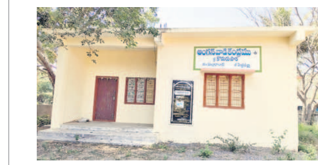
కోడురుపాకలో తాళం చేసి ఉన్న అంగన్ వాడీ కేంద్రం

ఎస్సార్ డి కాలువలు రూపురేఖలు కోల్పోయాయి. ఎన్నోవిండ్లుగా రైతుకు భరోసా ఇచ్చి, సాగుకు ఆదరువుగా మారిన వెంకటపూర్ ఇప్పుడు వూడికతో అధ్వానంగా మారిపోయాయి. అందుకు కొరట్ల మండలంలో ఎనిమిది గ్రామాలకు నీరందించే వెంకటపూర్ శివారులో ఎస్సార్ డి-40 కాలువే నిదర్శనంగా నిలుస్తున్నది. వందలాది ఎకరాల ఆయకట్టు కలిగిన ఈ కెనాల్ పిచ్చి మొక్కలతో నిండిపోయింది. ఈ సీజన్లో సాగుకు నీరందే అవకాశమే లేకుండా పోగా, రైతులు ఆందోళన చెందుతున్నారు. అధికారులు స్పందించి కాలువను పునరుద్ధరించాలని కోరుతున్నారు. - కోర్టుల దూరం, జనవరి 9