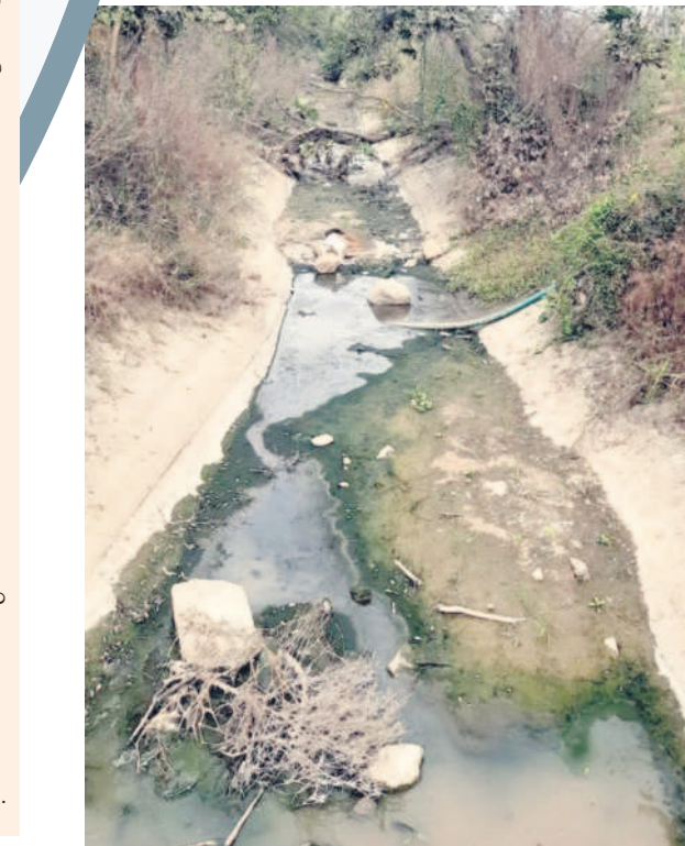
వెంకటపూర్ శివారులో ఎస్సార్ డి-40 కాలువ దుస్థితి

జగిత్యాల రూరల్, జనవరి 9: అర్జత, నైపుణ్యమున్న స్కీల్డ్ కార్మికులకు తెలంగాణ ఓపర్టిన్ మ్యూన్ పవర్ కంపెనీ లిమిటెడ్ టామ్ కామ్ కార్మిక, ఉపాధి క్షేత్ర, కార్యాలయ శాఖ కింద సింగపూర్ లో ఉద్యోగావకాశాలు కల్పిస్తున్నదని జగిత్యాల జిల్లా ఉపాధి కల్పన అధికారి సత్యగురువారం ఒక ప్రకటనలో పేర్కొన్నారు. సింగపూర్ లో మేషన్, స్టీల్ ఫ్యాక్టరీల కోసం ఖాళీలు ఉన్నాయని తెలిపారు. కనీస విద్యార్జిత పదో తరగతి ఉండి, 25 నుంచి 35 ఏళ్ల వయసున్న వారు, సింగపూర్ వెళ్ళాల్సిన వారు అర్హులని చెప్పారు. ఆసక్తి ఉన్న వారు శుక్రవారం కల్వర్లో రాష్ట్రంలోని ఎంప్లాయిమెంట్ కార్యాలయంలో జరిగే ఇంటర్వ్యూలకు హాజరు కావాలని కోరారు. మరిన్ని వివరాల కోసం ఫోన్ నంబర్లలో (9440049 861, 9440051452) సంప్రదించాలని సూచించారు.