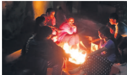
గోదావరిలో చలిమంటు కాగుతున్న కాలనీవాసులు

చలి తీవ్రత మళ్ళీ పెరిగింది. రెండు మూడు రోజుల నుంచి ప్రతాపం చూపుతున్నది. కనిపించినట్లుగా ఉష్ణోగ్రతలు ఏకంగా పడకొండు డిగ్రీలకు పడిపోగా.. గజగజా వణికిస్తున్నది. పొద్దుతా చల్లగాలులు వీస్తుండగా.. ప్రజలు ఇండ్ల నుంచి వెళ్ళేసరి పరిస్థితి ఉంటున్నది. కోల్డ్వెల్లులో మరీ దారుణంగా ఉన్నది. గురువారం 10.6 డిగ్రీలుగా నమోదు కాగా, ప్రజలు ఇబ్బందులు పడ్డారు. ఉదయం సాయంత్రం వేళల్లో చలిమంటు కాగుతున్నారు.