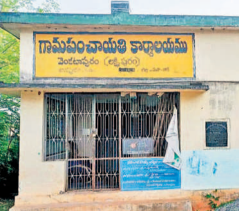
వెంకటాపురం పంచాయతీ భవనం

సర్వే అధికేషన్ లో గల్లంతైన వెంకటాపురం, అల్లిగూడెం పంచాయతీలు