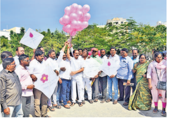
కాంగ్రెస్ ఎగ్జిక్యూటివ్ కమిటీలో కూడిన టెలంగాణ ఎగురవేస్తున్న దాస్యం విషయభాస్కర్