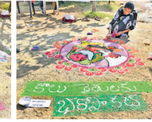
కాంగ్రెస్ సర్కారు హామీలను ప్రశ్నిస్తూ హనుమకొండ బీఆర్ఎస్ కార్యాలయంలో ముగ్గులు వేస్తున్న మహిళలు