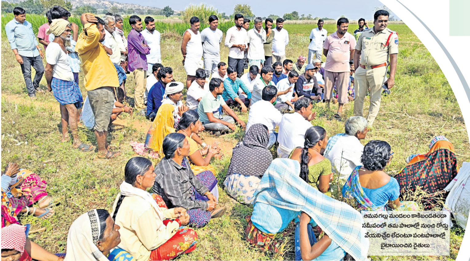
అమనగల్లు మండలం కాకిబండతండా సమీపంలో తమ పాలాల్లో నుంచి రోడ్డు వేయనిచ్చే లక్ష్యాన్ని పంపిణీ చేస్తున్న రైతులు