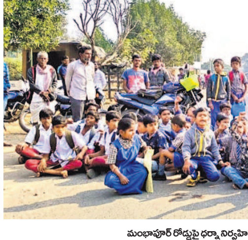
మంభాపూర్ రోడ్డుపై ధర్నా నిర్వహిస్తున్న విద్యార్థులు, జనగాం గ్రామస్థులు