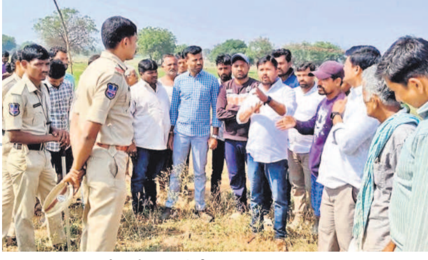
పోలీసులతో వాగ్వాదానికి దిగిన రైతులు