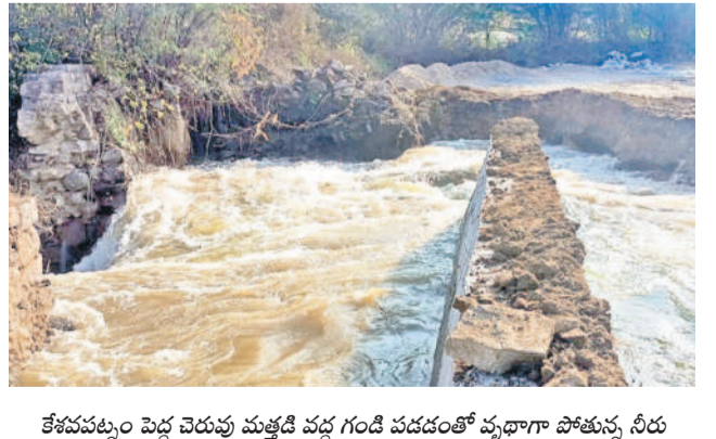
కేశవపట్నం పెద్ద చెరువు మట్టి వద్ద గండి పడడంతో వృధాగా పోతున్న నీరు