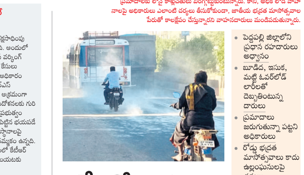
పెద్దపల్లి జిల్లాలోని ప్రధాన రహదారులు అధ్వానం

పెద్దపల్లి, జనవరి 8(నమస్తే తెలంగాణ): ప్రధాన రహదారులు అధ్వానంగా మారుతున్నాయి. పెద్దపల్లి జిల్లాలో ప్రమాదాలకు తోడ్పాటు నిలుస్తున్నాయి. 'రోడ్డు భద్రత.. ఆదరి బాధ్యత' అంటూ జాతీయ రోడ్డు భద్రతా మానోత్సవాలు నిర్వహిస్తున్న అధికారయంత్రాంగం, అందుకు తగ్గ చర్యలు తీసుకోకపోవడం వల్ల ప్రమాదాలు జరుగుతున్నాయని విమర్శలు వ్యక్తమవుతున్నాయి. ప్రధాన రహదారులైన గోదావరిఖని-కరీంనగర్, మంధని కరీంనగర్ రోడ్లపై ఇటీవలి కాలంలో రోడ్డుపై వాహనాలు అదుపు తప్పి బోల్డు పడుతున్న ముఖాలు అనేకం ఉన్నాయి. అలాగే గోదావరిఖని-కరీంనగర్, మంధని-కరీంనగర్ నుండి వందలాది బూడిద, ఇసుక లారీలు అధిక లోడితో వెళ్తుండగా, ఆ దారుల్లో భారీగా దుమ్ము లేస్తున్నది. వాటి వెనుక వచ్చే వాహనదారులకు ముందు రోడ్డు కనిపించక ప్రమాదాలు జరిగిన సందర్భాలు లేకపోలేదు. జిల్లాలో తరచూ ప్రమాదాలు జరిగే 28 ప్రాంతాలను పోలీసులు బ్లాక్ స్పాట్ గా గుర్తించారు. కానీ ఆయాచోట్ల సూచిత రేదా హెచ్చరిక బోర్డులు ఏర్పాటు చేయకపోవడం అధికారుల నిర్లక్ష్యానికి అద్దంపడుతున్నది.