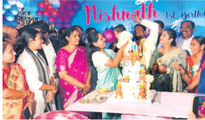
చిన్నారిని ఎత్తుకొని ముద్దు చేస్తున్న ఎమ్మెల్యే కల్వకుంట్ల కవిత

చెందిన గుర్తింపం. కాంగ్రెస్ నాయకుడు ఎలై లక్ష్మీనారాయణ తండ్రి పేరు రాజయ్య. తండ్రి పేరు గమనించకపోవడం వల్ల జరిగిన పొర పాటుతో కాంగ్రెస్ నాయకుడికి చెందిన భూమిగా ప్రచురితమైంది. ఈ స్థలంతో మాజీ ఛోసర్టి టిడర్ ఎలై లక్ష్మీనారాయణకు ఎటువంటి సంబంధం లేదు. తప్పగా ప్రచురణ జరిగిన విషయాన్ని తెలుసుకొని బుధవారం ఉదయమే నమస్తే తెలంగాణ నెట్ ఎడిషన్ ను మార్చాం. జరిగిన పొరపాటుకు చింతించడంతోపాటు పూర్తి వివరణ ఇస్తున్నాం.