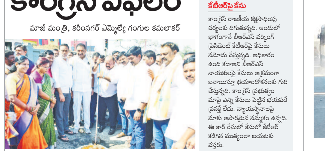
పద్మనగర్ జంక్షన్ బిల్డింగ్ నిర్మాణానికి భూమి పూజ చేస్తున్న ఎమ్మెల్యే గంగుల

మాజీ మంత్రి, కరీంనగర్ ఎమ్మెల్యే గంగుల కమలాకర్