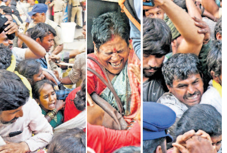
తిరుపతిలో బుధవారం వైకుంఠద్వార దర్శనం బోకెళ్ల జారీ కేంద్రాల వద్ద జరిగిన తొక్కిసలాట దృశ్యాలు

తెలంగాణలో కలపిల్లి లేదు 'తెలంగాణ ఒక అభివృద్ధిని రాష్ట్రం. తెలంగాణలో ఆంధ్ర ప్రదేశ్ లాగా కులపిల్లి లేదు. బోలాచనం, మనసున్న మనుషులు, సహకరించే మనుషులున్న రాష్ట్రం తెలంగాణ' అని జయప్రకాశ్ నారాయణ > 3వ పేజీలో