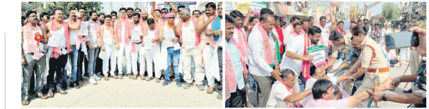
వేములవాడ: తెలంగాణ వాక్ వర్ష అధ్యనగ్న ప్రదర్శనలో బీఆర్ఎస్ నాయకులు