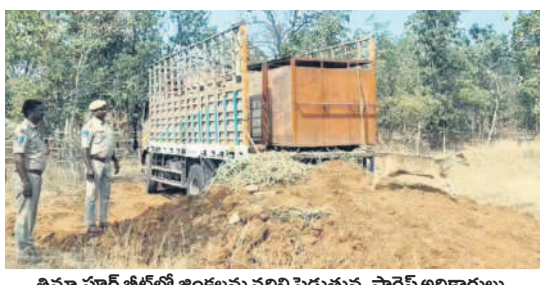
తిమ్మాపూర్ బీదర్ జింకలను వదిలి పెడుతున్న ఫాలోవర్స్ అధికారులు