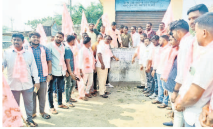
రామారావుపేటలో రైతుభరోసా బకాయిల పోస్టును అంబేద్కర్ జిల్లాలోని నాయకులు