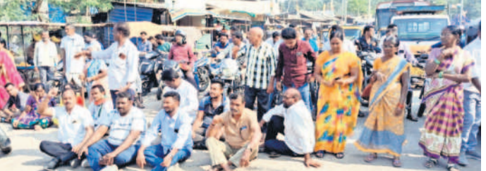
బెల్లంపల్లిలోని కాంటా చౌరస్తా వద్ద రాజింగోటి చేస్తున్న రిజిల్టర్ కార్డులకు, వారి కుటుంబ సభ్యులు