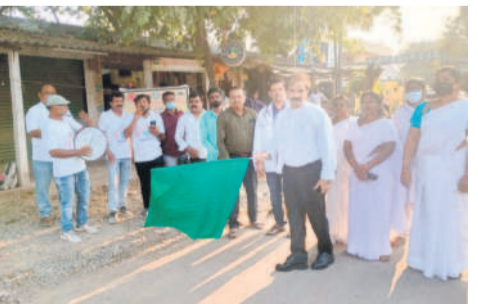
ప్రధాని ప్రారంభిస్తున్న మంచిర్యాల డిపాట్మెంట్ హెల్త్ కేంద్రం