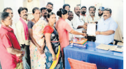
వినతివృత్తం అందజేస్తున్న మున్సిపల్ కార్మికులు, నాయకులు