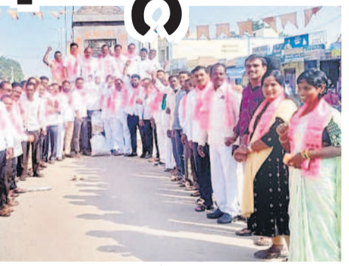
భీరనూర్ మండల కేంద్రంలో ధర్మా చేస్తున్న బీఆర్ఎస్ శ్రేణులు

లంపెందన్నారు. కాంగ్రెస్ పార్టీ మాంయమాలలు చెప్పి రైతుల ఓట్లు దండకొని అధికారం లోకి వచ్చిందన్నారు. ఆ పార్టీ నేతలు రామాలోగం డి, సీఎం రేవంత్ రెడ్డి, మంత్రి, ఎమ్మెల్యేలు రాష్ట్ర ప్రజాసేవా కేంద్రం లో ముక్కు నేలకు రాయాలన్నారు. రైతులకు ఇచ్చిన హామీ ప్రకారం రైతు భరోసా కింద ఎక్కానాని రూ.15వేల ఇస్తామని చెప్పింది, రూ.12వేల ఇచ్చి చేతులు దులుపుకుంటామంటే సహించి దేదిన స్వస్థం చేశారు.