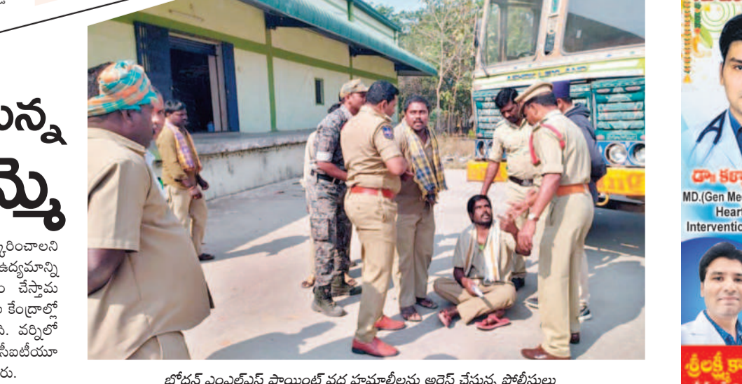
బోధన్ ఎంపీలను పొయిల్ వద్ద హామాలను అరెస్టు చేస్తున్న పోలీసులు