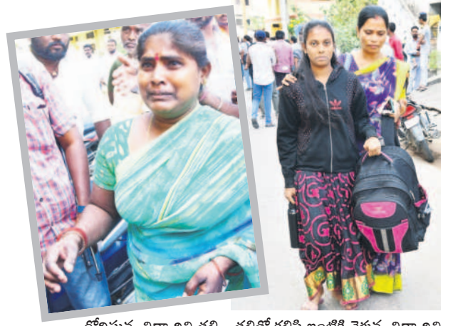
రోడ్డుపై విద్యార్థిని తల్లి తల్లితో కలిసి ఇంటికి వెళ్తున్న విద్యార్థిని

కరీంనగర్ కలెక్టరేట్, జనవరి 7: కరీంనగర్ లోని శర్వనగర్ మహా త్యాజ్యోత్సవాల్లో బాలికల గురుకులంలో సోమవారం రాత్రి ఫుడ్ పాయిజన్తో 31 మంది విద్యార్థినులు అస్వస్థతకు గురయ్యారు. కడుపునొప్పి, వాంతులు, విరేచనాలతో అల్లరాత్రి నుంచే బాధపడుతుండగా, వసతి గృహ ఆధికారి, సిబ్బంది వారిని ప్రభుత్వ దవాఖానకు తరలించి చికిత్స చేయించారు. విషయం తెలిసిన తల్లిదండ్రులు ఆందోళనకు గురై, రోడ్డు దవాఖానకు చేరుకున్నారు. చికిత్స అనంతరం పిల్లలు కోలుకోవడం, ప్రమాదం ఏమీ లేదని వైద్యులు ప్రకటించడంతో తల్లిదండ్రులు, అధికారులు ఊపిరి పీల్చుకున్నారు. సాయంత్రం కల్లా విద్యార్థినులను హాస్టల్ కు తరలించారు. ఉన్నతాధికారుల ఆదేశాలతో అస్వస్థతకు గురైన వారికి అనారోగ్య సేవలు ఇచ్చి, ఇండ్లకు పంపించారు. ఈ ఘటనపై విద్యార్థి సంఘాల నాయకులు గురుకులం ఎదుట ఆందోళన చేశారు.