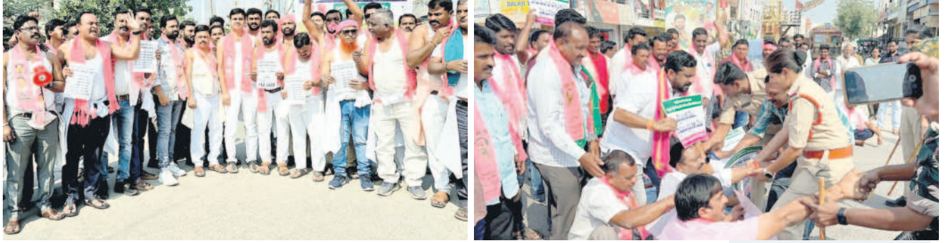
వేములవాడ: తెలంగాణ వాక్ వర్ష అధ్యనగ్న ప్రదర్శనలో బీఆర్ఎస్ నాయకులు