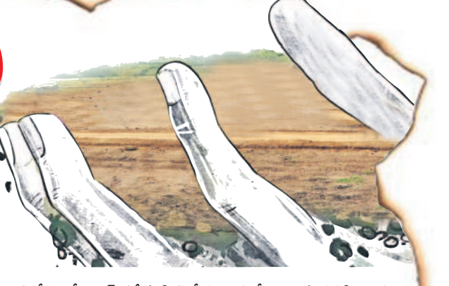
సంగీతం శ్రీనివాస సతీమణి సంగీతం విద్య పేరిట ఉన్న ధరణి లికాఫర్

కాంగ్రెస్ నాయకుల కబంధ హస్తాల్లో ఎకరాల కొద్దీ అసైన్డ్ భూములు చిక్కుకున్నాయి. చాలా మంది నాయకులు సదరు అస్థలను ఏకైకంగా అనుభవిస్తున్నారని విమర్శలున్నాయి. 2004 నుంచి 2014 వరకు అనాటి కాంగ్రెస్ ప్రభుత్వ హయాంలో ఆ ల్యాండ్స్ ను కాజేసినట్లు బయటపడుతున్నది. గుట్టుపప్పుడు కాకుండా లికాఫర్లో పేర్లు రాాయుతున్నారని పట్టాదారు పాను పుస్తకాలు పొందడమే కాదు, కొంత మంది ఏకంగా క్రమవిక్రయాలు చేసినట్లు తెలుస్తున్నది. అయితే సిరిసిల్ల నియోజకవర్గంలో బీఆర్ఎస్ నాయకులు తప్పకుండా లికాఫర్ ద్వారా అసైన్డ్ భూములు అక్రమించుకున్నారంటూ అరెస్టులు చేస్తున్న విషయం తెలిసింది. అంతేకాదు, అరెస్టుల పరంపర ఇంకా కొనసాగుతుండనే సంతోషాన్ని అధికార పార్టీ నాయకులు ఇస్తున్నారు. అలాగే ఎకరాల కొద్దీ అసైన్డ్ ల్యాండ్స్ ను బీఆర్ఎస్ నాయకులు అక్రమించుకున్నారంటూ ప్రజల్లోకి తప్పుడు సంతోషాలు వ్యాపిస్తున్నాయి. నిజానికి లోతుగా వెళ్తే ఎంతో మంది హస్తం నాయకులు అసైన్డ్ స్థలం చెరచారు. ఒకటి రెండెకరాలు కాదు, ఏకంగా ఇదెకరాలను కూడా కైవసం చేసుకున్న నాయకులున్నారు. అసైన్డ్ భూములను ఎంతకా అనుభవిస్తున్న పలువురు కాంగ్రెస్ నాయకుల జాబితా 'సమస్త తెలంగాణ' సంపాదించింది. వాటిని ప్రజలకు తెలుపడమే లక్ష్యంగా వివరాలు విస్తారంగా చేస్తున్నది. ఇవి ముప్పుకే అయినా.. లోతుగా వెళ్తే ఇంకా చాలా మంది అసైన్డ్ భూముల దండా బయటపడుతుంది.