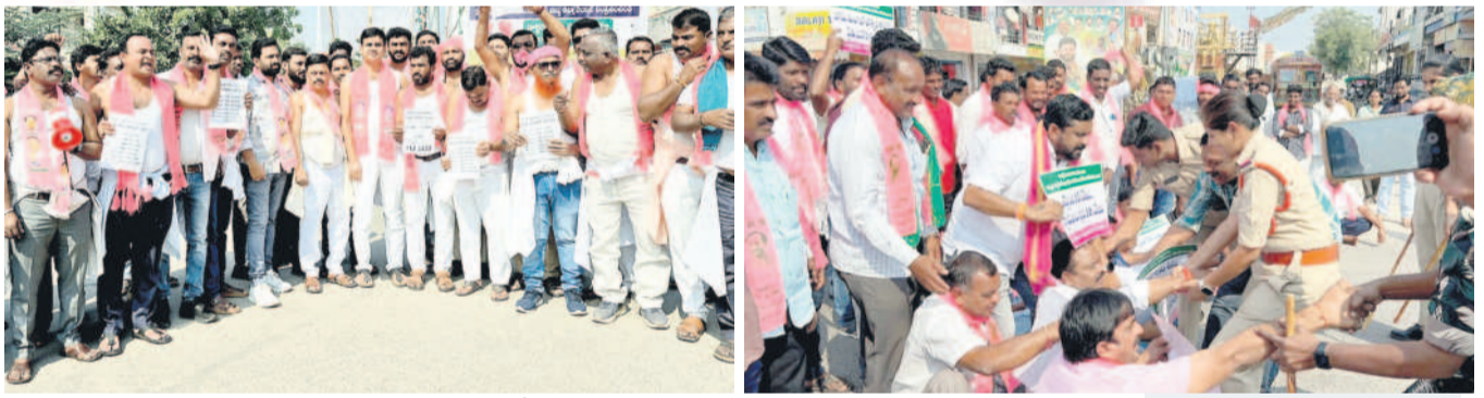
మేములవాడ: తెలంగాణ వాక్ వర్ష అధ్యనగ్న ప్రదర్శనలో టీఆర్ఎస్ నాయకులు