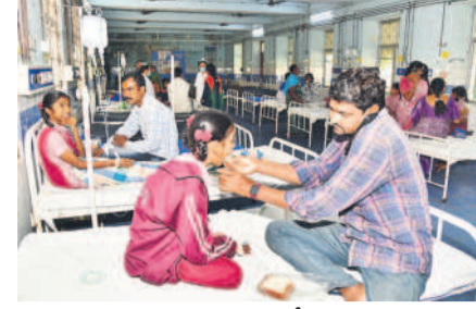
కరీంనగర్ ప్రధాన దవాఖానలో చికిత్స పొందుతున్న విద్యార్థినులు

కరీంనగర్ శర్వనగర్ విద్యాలయంలో 31 మంది విద్యార్థినులకు అస్పష్టత