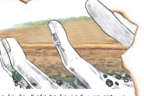
సంగీతం శ్రీనివాస్ సతీమణి సంగీతం విద్య పేరిట ఉన్న ధరణి రికార్డు

కాంగ్రెస్ నాయకుల కబంధ హస్తాల్లో ఎకరాల కొద్దీ అసైన్డ్ భూములు విక్రమిస్తున్నాయి. చాలా మంది నాయకులు సదరు అస్సలను ఏళ్లకేళ్లుగా అనుభవిస్తున్నారన్న విషయం తెలుసుకుంటే.. 2004 నుంచి 2014 వరకు అనాటి కాంగ్రెస్ ప్రభుత్వ హయాంలో అసైన్డ్ భూములు కాజేసినట్లు బయటపడుతున్నది. గుట్టుపప్పుడు కాకుండా రికార్డుల్లో పేర్లు రాయింపకొని పట్టణాధికారి పాను పుస్తకాలు పొందడమే కాదు, కొంత మంది ఏకంగా క్రయవిక్రయాలు చేసినట్లు తెలుస్తున్నది. అయితే సీనియర్ నియోజకవర్గంలో టీఆర్ఎస్ నాయకులు తప్పుడు రికార్డుల ద్వారా అసైన్డ్ భూములు ఆక్రమించుకున్నారంటూ అరెస్టులు చేస్తున్న విషయం తెలిసిందే. అంతేకాదు, అరెస్టుల పరంపర ఇంకా కొనసాగుతున్నట్లు సంతకాన్ని అధికార పార్టీ నాయకులు ఇస్తున్నారు. అలాగే ఎకరాల కొద్దీ అసైన్డ్ లాండ్స్ ను టీఆర్ఎస్ నాయకులు ఆక్రమించుకున్నారంటూ ప్రజల్లోకి తప్పుడు సంతకాలు వెళ్తున్నాయి కుట్రలు చేస్తున్నారు. నిజానికి లోతుగా వెళ్తే ఎంతో మంది హస్తం నాయకులు అసైన్డ్ ను చెరచేస్తారు. ఒకటి రెండెకరాలు కాదు, ఏకంగా ఐదెకరాలను కూడా కైవసం చేసుకున్న నాయకులున్నారు. అసైన్డ్ భూములను ఎంచుకొని అనుభవిస్తున్న వలుపురు కాంగ్రెస్ నాయకుల జాబితా వివరాలు బహిష్కారం చేస్తున్నది. ఇవి మామూలే అయినా.. లోతుగా వెళ్తే ఇంకా చాలా మంది అసైన్డ్ భూముల దండా బయటపడుతుంది.